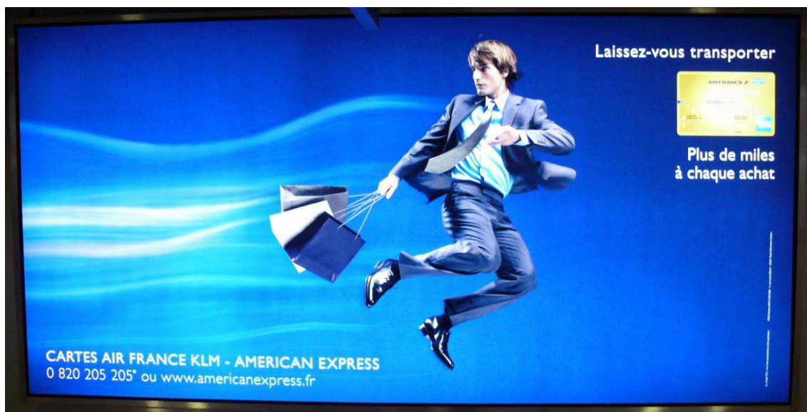
Figure 3. La recherche de l'accumulation de « miles statutaires » : exemple d'une carte de paiement associée à une compagnie aérienne.