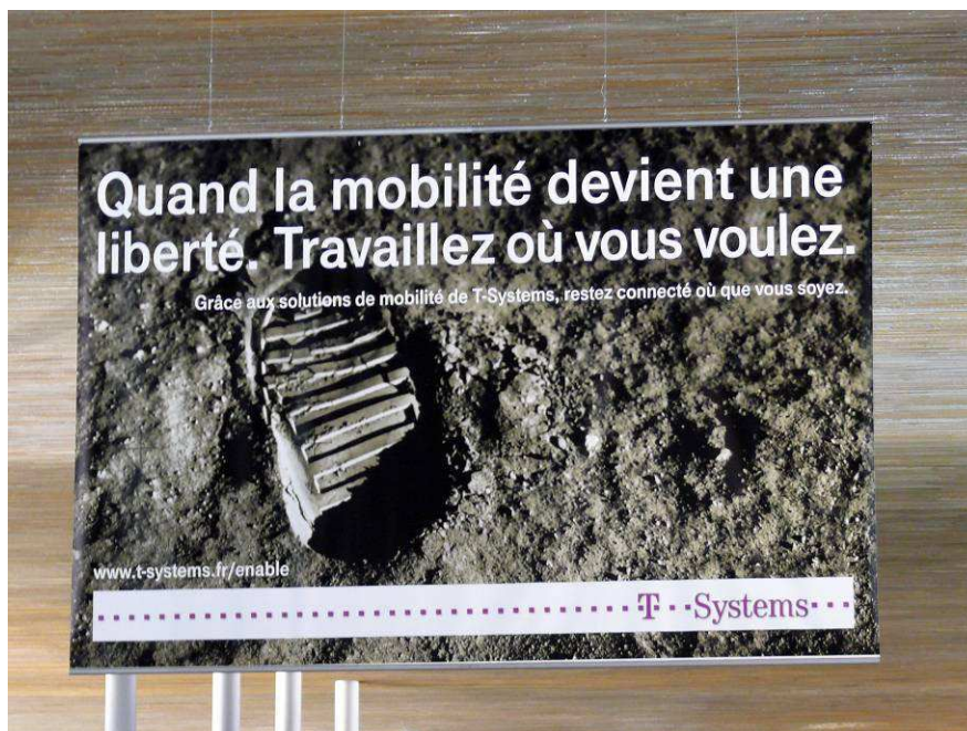
Figure 5. L'ambiguïté du temps de déplacement, entre travail et loisir : l'exemple d'une publicité de services informatiques.

Ces quatre registres expriment ainsi une catégorisation distinctive de la mobilité qui s'appuie sur l'expérience et l'imaginaire emblématique du déplacement aérien et de l'aéroport pour faire de la mobilité l'expérience de franchissement de grandes distances et un principe d'action qui serait tout à la fois héroïque, électif et libérateur des contraintes du quotidien. C'est seulement en creux qu'elle nous donne à voir la proximité, la routine, le retard, la fatigue, le cadre national et ses frontières. Mais quel est le rapport qu'entretiennent les passagers avec cette catégorisation ?