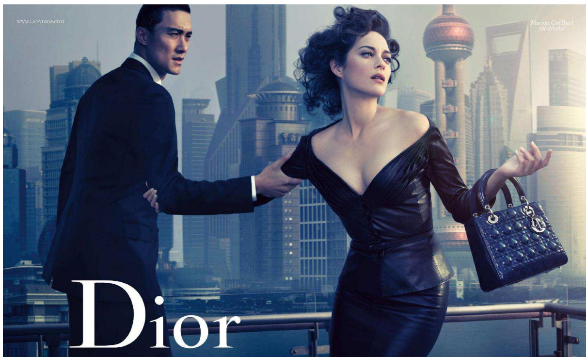
Figure 2. Accès à l'ailleurs et consommation ostentatoire : exemple d'une publicité pour un accessoire de mode féminin.