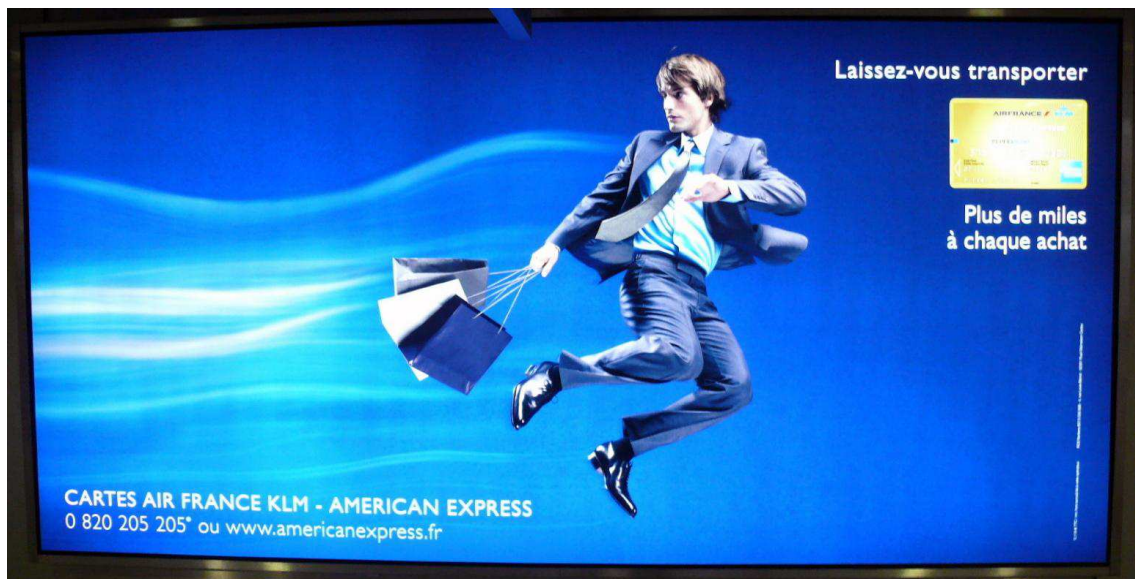
Figure 3. La recherche de l'accumulation de « miles statutaires » : exemple d'une carte de paiement associée à une compagnie aérienne.