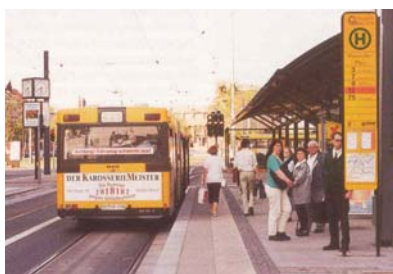
Společné jízdní pruhy pro TRAM a BUS nabízejí i zřízení společné, tj. pro cestující přehledné zastávky (Drážďany)