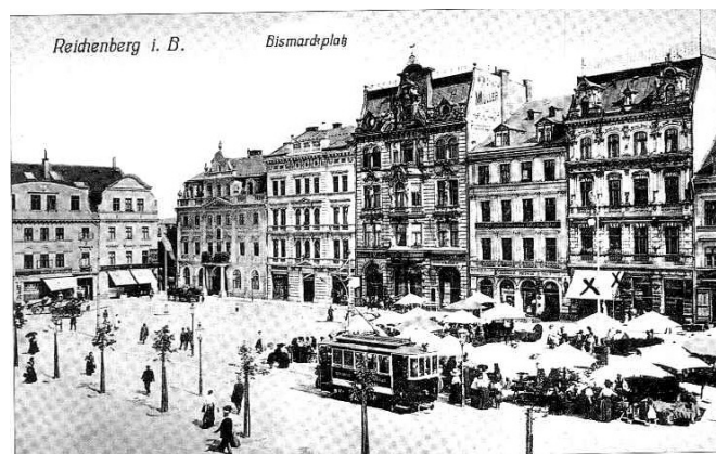
Veřejná doprava dříve byla nejen páteří dopravního systému měst, ale svou koexistencí s pěšími se zásadním způsobem podílela na utváření hodnotného městského parteru (příklad Liberec)