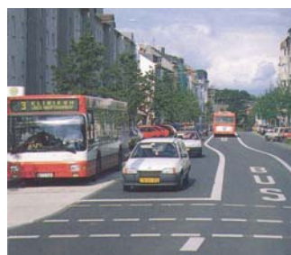
Vyhrazené jízdní pruhy pro BUS lze mnohdy vhodně zřídit i v relativně užších uličních profilech (Německo)