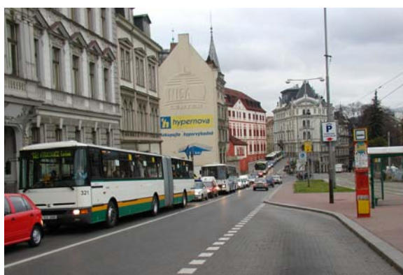
Dopravní kongesce, které zdržují automobily i vozidla MHD, dnes postihují i naše krajské metropole (Liberec)