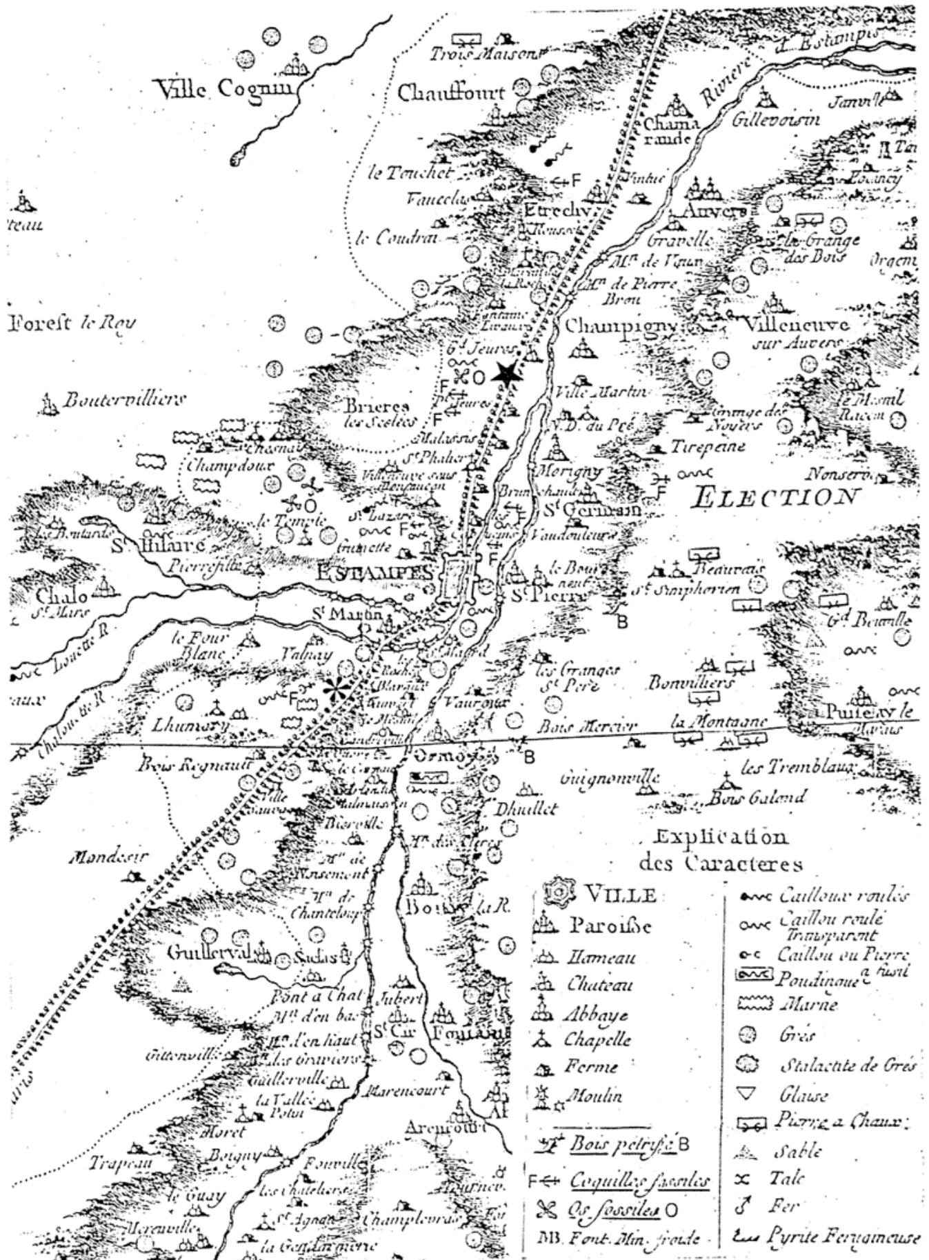
Extrait de la Carte minéralogique de l'élection d'Estampes (accompagnant le Mémoire sur les poudingues de Guettard, 1753), agrandi