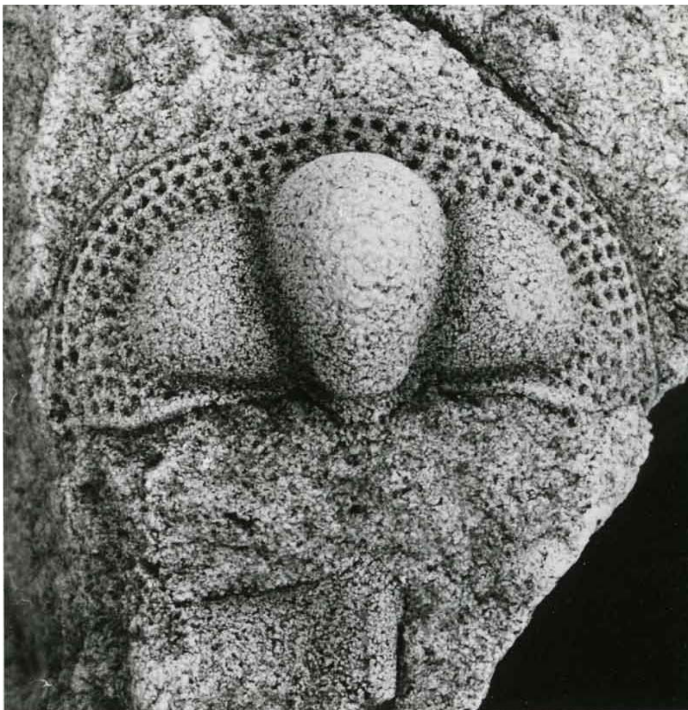
Le trilobite numéro 2 : Trinucleus "ornatus"

TRILOBITES n° 2 et 3 : Trinucleus "ornatus" et Dalmanites "cf. caudata" (Ordovicien supérieur - Nui-Nga-Ma près Ben-Thuy, Nord-Annam).