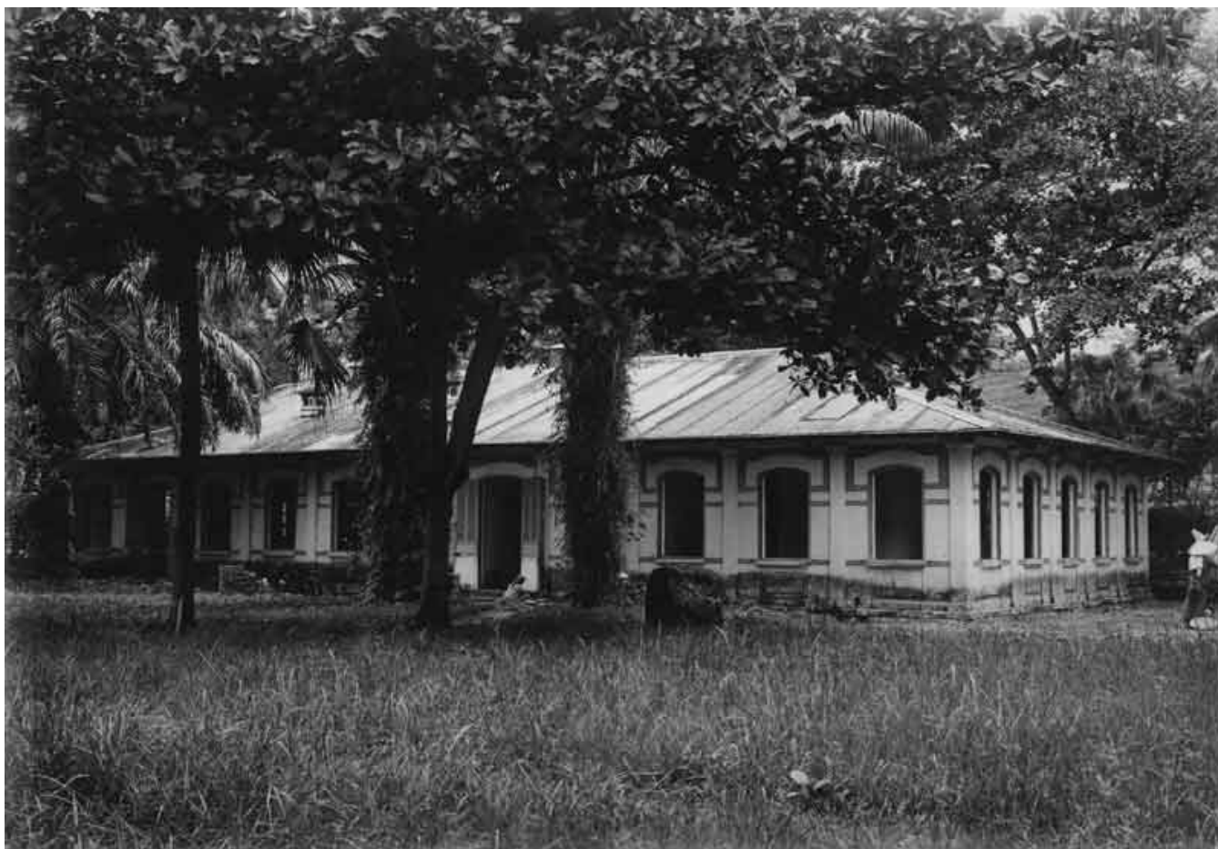
Le bâtiment du service géologique d'Indochine à Hanoï, peu avant sa démolition en mai 1928