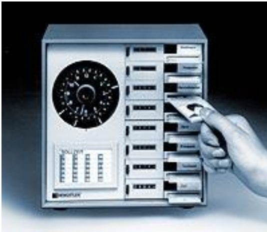
Figure 3: Flextimer, appareil d'enregistrement du temps avec compteurs électromécaniques 1970 6

La norme temporelle des horaires individualisés a conduit à un espace d'innovation technologique. Elle a ouvert et renouvelé le marché des appareils d'enregistrements des temps. Mais ensuite ce sont les dispositifs techniques et commerciaux qui ont donné leur nom à la norme sociale. L'appellation Flextime s'est répandue dans le monde anglo-saxon. Au cœur d'une stratégie de marketing et de publicité la vente de nouveaux appareils s'est faite en louant les bienfaits des horaires individualisés 7 . Néanmoins la machine provoquera une première réforme d'opposition montrant que le dispositif technique doit être situé dans le prolongement du dispositif social des horaires individualisés. A cet égard, on pourrait parler de la création d'un système sociotechnique qui n'a pas manqué de susciter des interrogations quant aux changements qu'il a introduits dans la vie quotidienne des salariés.