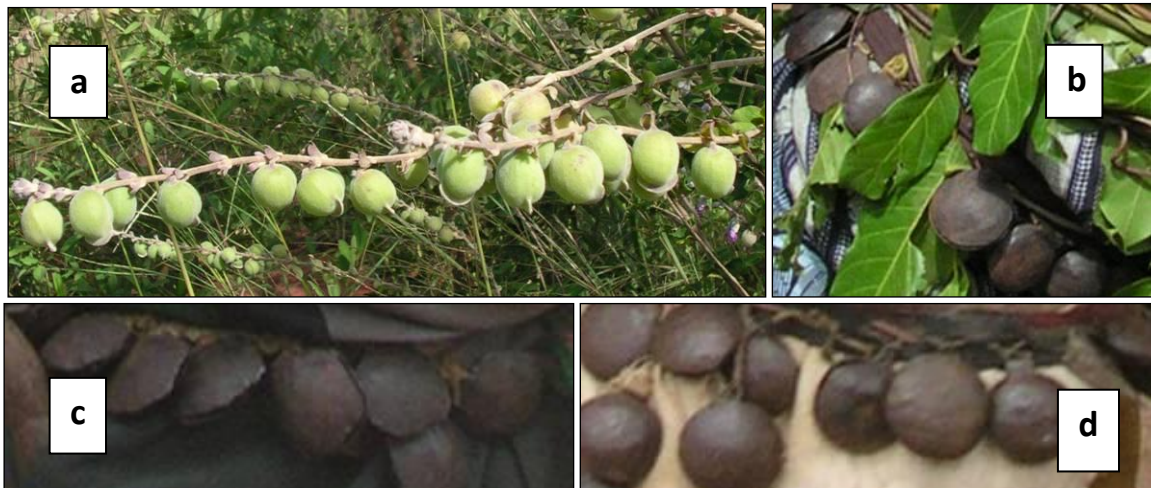
Figure 1. L’espèce Tinnea barteri et les grelots des danseurs :

Si on n’avait que ce type de composé, on serait tenté de dire qu’en l’absence de terme simple, la dénomination des plantes dépendra soit de l’emploi auquel elles sont destinées, soit d’un aspect formel par lequel elles ressemblent à un autre objet. Malheureusement, on ne pourra pas faire rentrer tous les composés dans ces catégories sémantiques, du moins pas sans enquête approfondie. Considérons par exemple l’espèce Tinnea barteri Gürke (Figure 1) de la famille des Lamiaceae, bāārñ-gbōngbāl , qui a des fruits qui ressemblent aux grelots portés par certains danseurs lors de fêtes traditionnelles (Fig. 1) : ce nom signifie littéralement “grelot de lièvre”. Si le rapport formel avec le grelot est manifeste, nous ne pouvons pas savoir a priori pourquoi cet objet doit appartenir au lièvre.