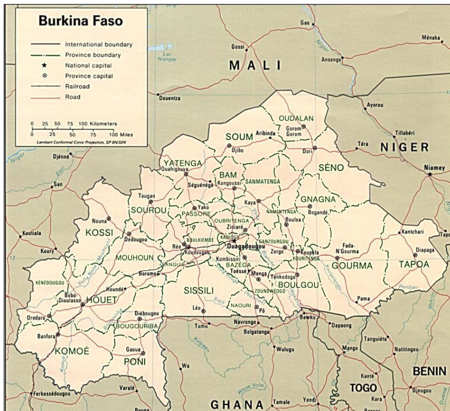
Carte 1 : Burkina Faso politique 1996