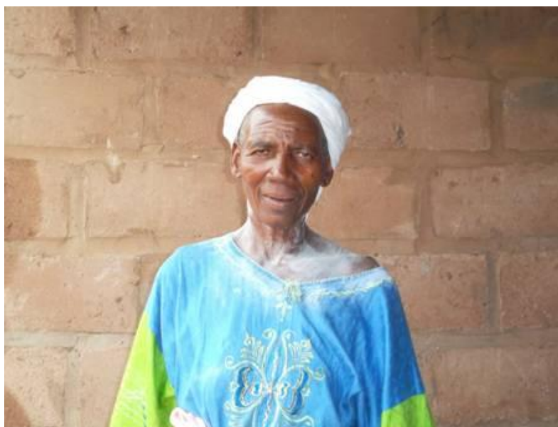
Fig. 2 L'actuelle sà-zǎn-ge - cíd-dě-ŋe (la vieille femme du bois sacré)