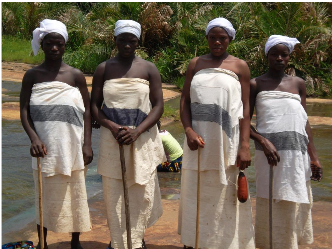
Fig. 4 Initiées avec leurs bâtons