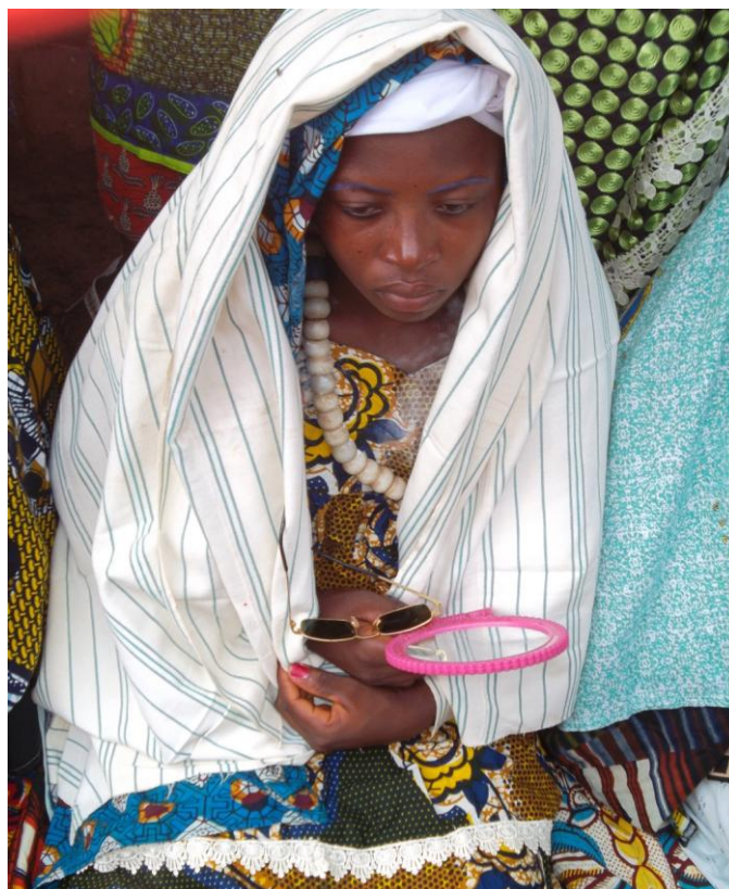
Fig. 5 Une initiée à sa descente du sàzàné

Les filles se rendent ensuite dans le lignage des Coulibaly. Pendant le trajet, elles ne regardent pas ceux qui les entourent et marchent tête baissée dans une attitude de deuil et de tristesse 17 .