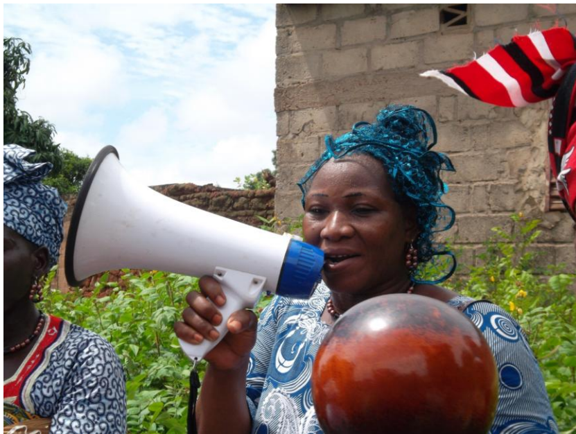
Fig. 20 Une chanteuse de sicà?áné avec un mégaphone, une illustration du goût partagé pour les produits industriels

Ce sont là les principaux paramètres pris en compte dans les adaptations du rite dont il va maintenant être question.