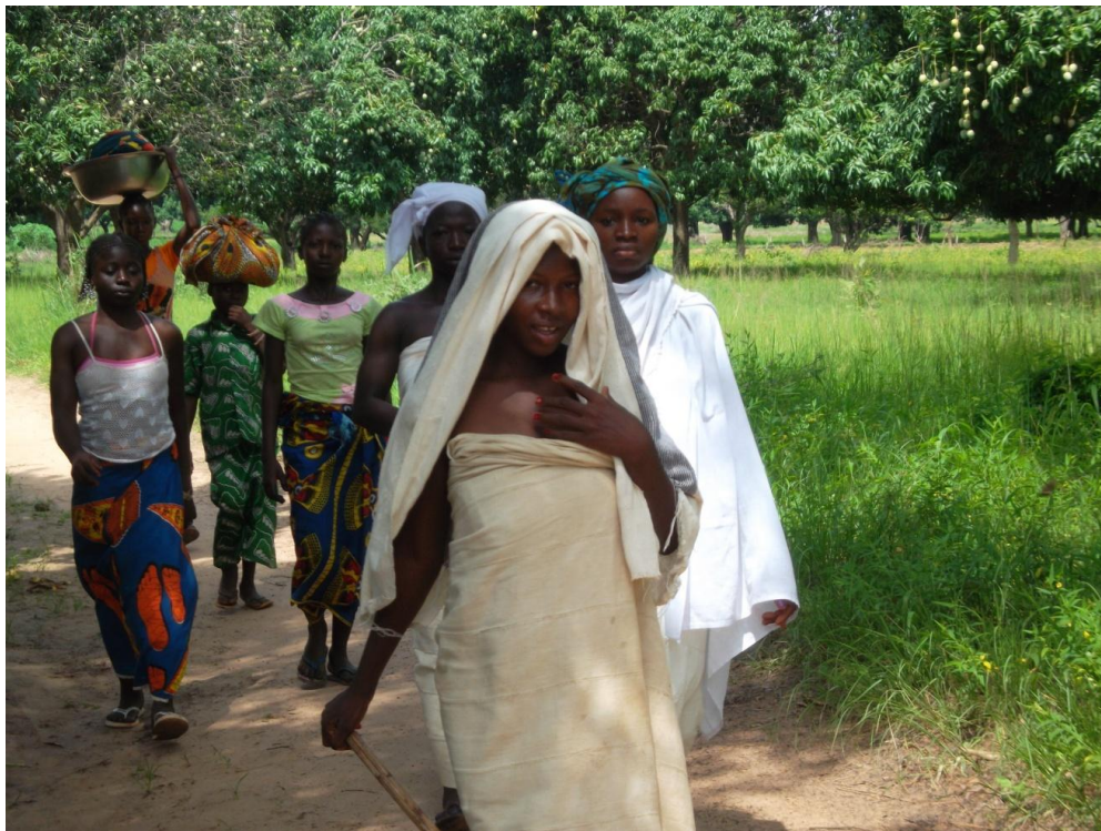
Fig. 9 Des initiées allant à la rivière, suivies des « petits maris »

Durant les quatre semaines qu'elles passent ensemble, les filles vont chaque matin à la rivière Dópèyé 22 pour faire la lessive (Fig. 9). Elles sont suivies par les tò-kón-nà-bi [ tòkónàbí ] (/tomber couper mari cl./ litt. maris des « coupées tombées ») qui sont généralement les sœurs cadettes non initiées de leurs futurs maris et que l'on appelle en français local « les petits maris ».