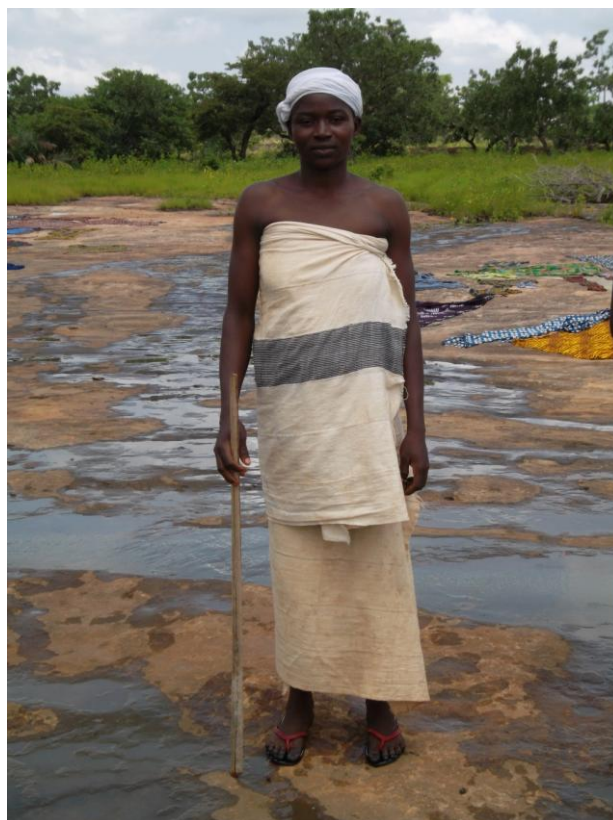
Fig. 10 La responsable des initiées en 2012

Dans l'après-midi, la responsable du groupe (Fig. 10), qui est toujours choisie dans le lignage des Coulibaly, est la première à se jeter dans la rivière où elles s'ébattent avant de s'enduire le corps de beurre de karité auparavant fondu au soleil, puis de s'habiller (Fig. 11, Fig.12, Fig.13 et Fig. 14). Le beurre est censé adoucir et embellir la peau.