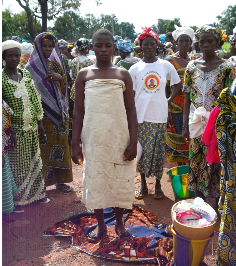
Fig. 3 Une initiée après la toilette rituelle