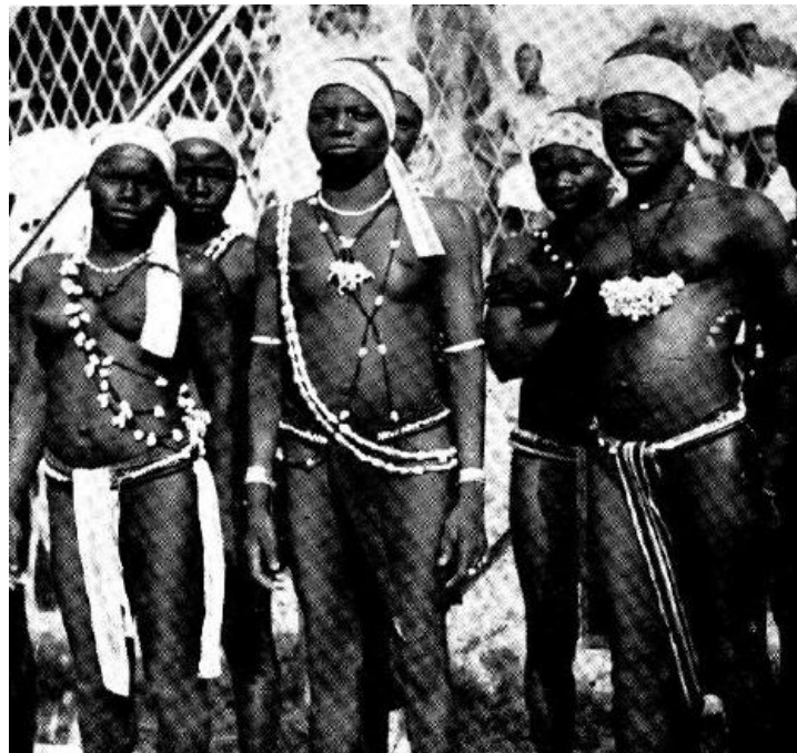
Fig. 18 Parure cérémonielle des jeunes initiées senoufo (région de Sinématiali, Holas 1956)

Cet acte, qui marque la fin des cérémonies d'initiation, est la consécration des filles dans leur nouveau statut. Une grande fête s'organise au son du balafon et du hochet et chaque excisée porte ses habits d'apparat (Fig. 18 24 ). Les initiées font à nouveau le tour du village pour remercier les divinités des différents lignages. Ce jour-là, elles chantent et insultent les hommes qui les écoutent. Une fois le circuit terminé, les initiées se retrouvent dans leurs lignages et la fête continue au son du balafon et du hochet. Une fois la cérémonie terminée, la jeune fille regagne le domicile parental et, chaque soir, elle se rend dans la concession de son futur mari pour y passer la nuit, jusqu'au jour où elle aura sa propre cuisine 25 . Devenue femme après être passée par cette expérience à la fois physique, intellectuelle et spirituelle, l'initiée est alors prête pour le mariage.