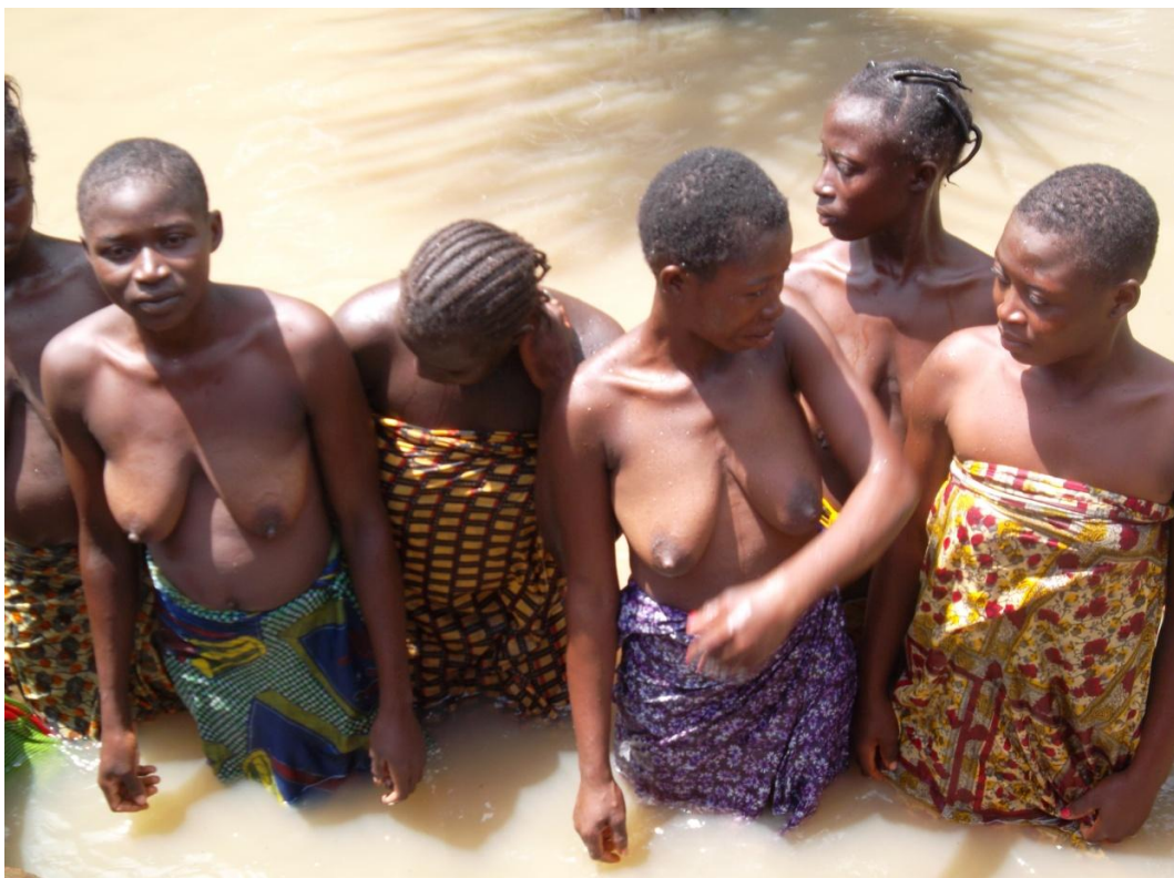
Fig. 12 Le bain des initiées