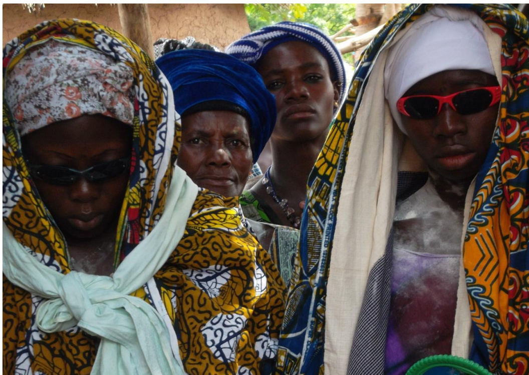
Fig. 22 Initiées en tenue moderne

Quant à la tenue traditionnellement blanche et noire, elle est progressivement complétée, voire remplacée, par des tissus colorés d'importation (cf. Fig. 22). Autre trace de l'intégration de la modernité à la tradition, les lunettes de soleil semblent avoir une importance particulière dans la tenue portée après la toilette rituelle. En effet, le prétendant qui n'arrive pas à procurer une paire de lunettes à sa promise est sommé d'en chercher le jour de la cérémonie, sans quoi il sera redevable d'une amende à verser aux femmes du lignage de sa future épouse. Les enquêtes ne permettent pas de comprendre si l'importance accordée aux lunettes (leur absence entraîne une amende) est strictement liée au rôle esthétique de cet élément ou s'il faut y voir une fonction plus symbolique.