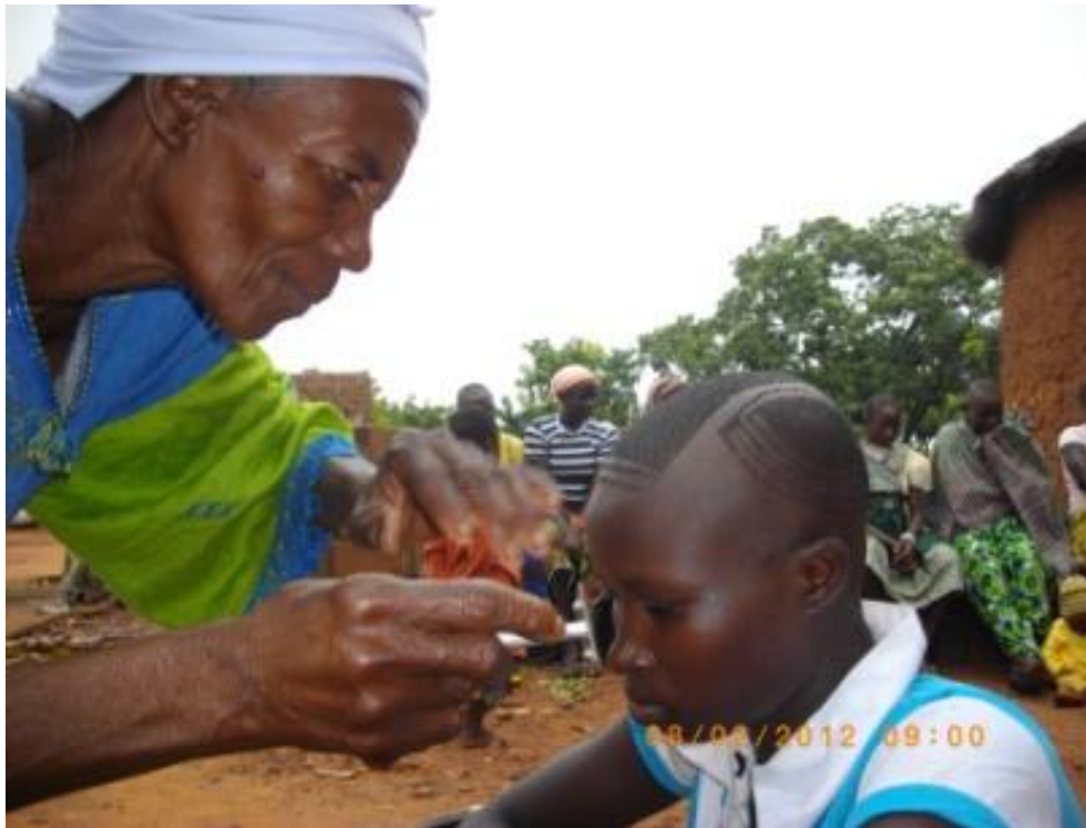
Fig. 16 L'actuelle sàzàṅé cídèṅé en train de faire des figures de rasage sur la tête d'une initiée (M. Traoré 2012)