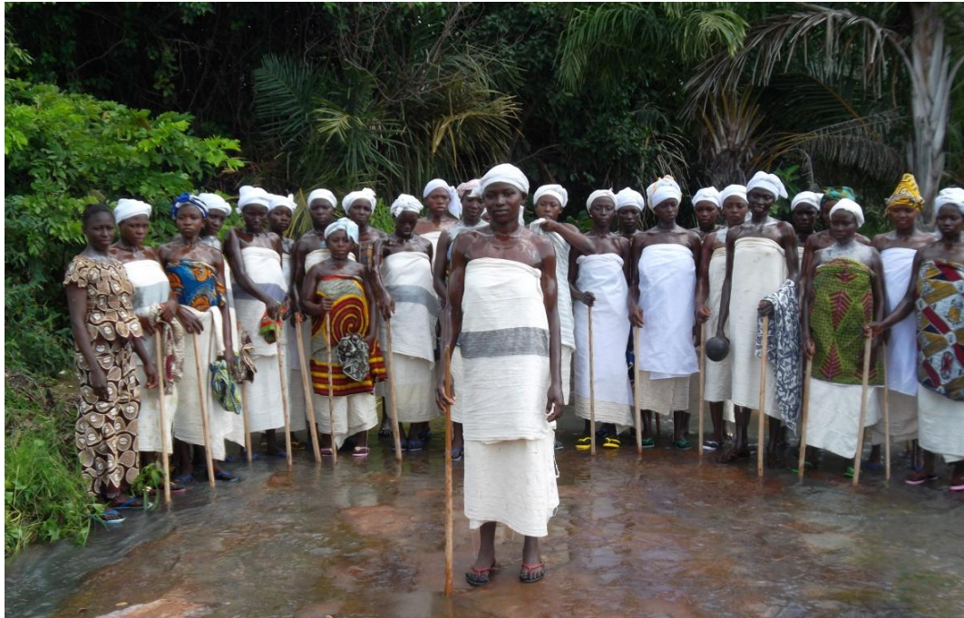
Fig. 14 Les initiées enduites de beurre de karité