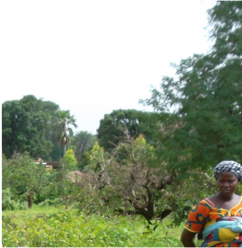
Fig. 1 Le bois sacré

cíd-dě-ŋe [ sàzàŋé-cídèŋé ] (/lieu caché vieille femme cl./ litt. la vieille femme du sàzàŋé ) est généralement la femme la plus âgée du lignage des Coulibaly (Fig. 2). Elle est chargée de fixer la date de l'initiation, de faire tous les sacrifices nécessaires pour que le rite se déroule correctement. Durant l'initiation, elle tient le rôle de maîtresse de cérémonie.