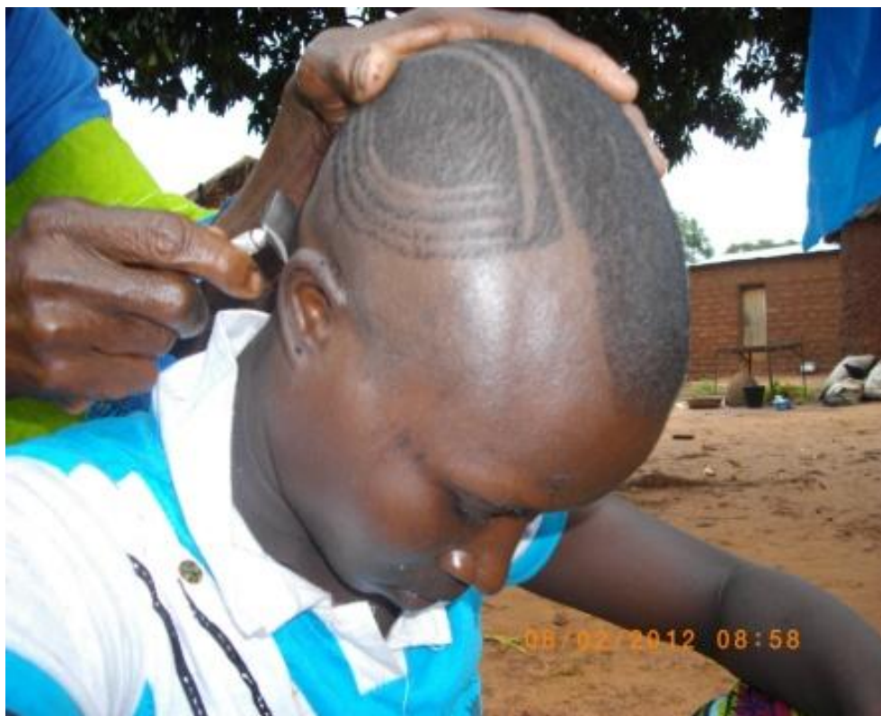
Fig. 17 L'actuelle sàzàṅé cídèṅé en train de faire des figures de rasage sur la tête d'une initiée (M. Traoré 2012)