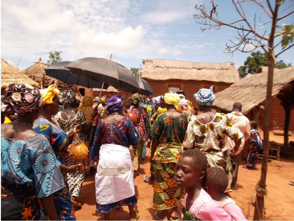
Fig. 6 Lors de l'hommage

Les initiées commencent alors un circuit à travers le village qui va les conduire dans chacun des lignages (voir Fig. 6, Fig. 7). Elles sont accompagnées exclusivement par les femmes et les chanteuses de sì-cǎk-né [ sìcà?áné ] (/chose-secouer-cl./ litt. la chose qu'on secoue, hochet). Chaque initiée a un groupe de chanteuses de sìcà?áné à ses côtés 18 . Lors du premier arrêt, chez les Coulibaly, elles vont chez la vieille femme du bois sacré pour lui demander des bénédictions, ainsi qu'aux responsables de l'initiation (Coulibaly).