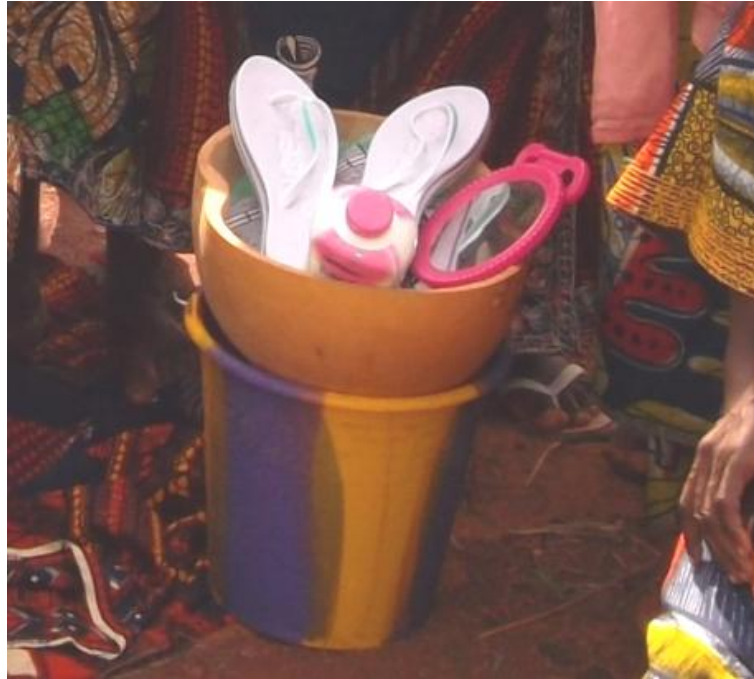
Fig. 21 Les effets de toilette d'une initiée

Quant à la tenue traditionnellement blanche et noire, elle est progressivement complétée, voire remplacée, par des tissus colorés d'importation (cf. Fig. 22). Autre trace de l'intégration de la modernité à la tradition, les lunettes de soleil semblent avoir une importance particulière dans la tenue portée après la toilette rituelle. En effet, le prétendant qui n'arrive pas à procurer une paire de lunettes à sa promise est sommé d'en chercher le jour de la cérémonie, sans quoi il sera redevable d'une amende à verser aux femmes du lignage de sa future épouse. Les enquêtes ne permettent pas de comprendre si l'importance accordée aux lunettes (leur absence entraîne une amende) est strictement liée au rôle esthétique de cet élément ou s'il faut y voir une fonction plus symbolique.