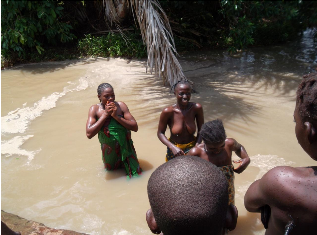
Fig.11 Le bain des initiées