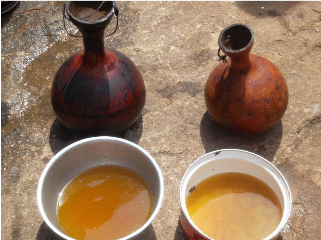
Fig. 13 Le beurre de karité fondu au soleil