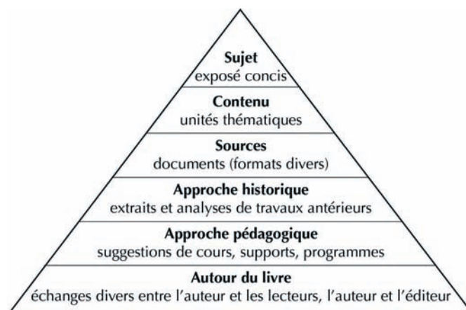
Figure 2. Proposition d'organisation pyramidale du livre électronique (d'après Darnton, 1999).

le même ouvrage au format papier). Robert Darnton imaginait déjà en 1999 une organisation du livre électronique enrichi sous forme pyramidale (Figure 2).