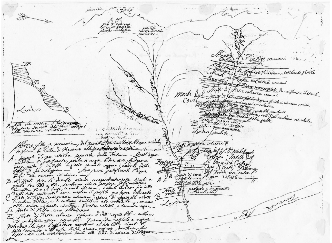
Fig.1. - Le flanc nord du Monte Spitz, et le cadre géologique des sources minérales de Reccoaro (Stegagno, 1929, pl.IX). (Croquis fait en Octobre 1758).

Traduction de la légende donnée à gauche par Arduino :