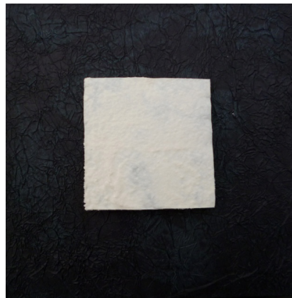
Bicareful fragil (détail avant rupture 20X20), V. Peres

Véronique Peres propose une évocation de la fragilité qui s'appuie sur une courte nouvelle « Les volets » [12] dans laquelle elle évoque le jour douloureux où elle a basculé dans l'âge adulte, faisant écho à des déchirements intérieurs. D'un côté des petits carrés de toile brodée de rouge habillés de papiers froissés blanc, de l'autre des toiles marouflées de noir, ponctuation musicale de notes courtes ou longues. La fragilité est suggérée par les papiers déchirés et les feuilles de porcelaine-papier translucides, mises en relief sur leurs supports de bois.