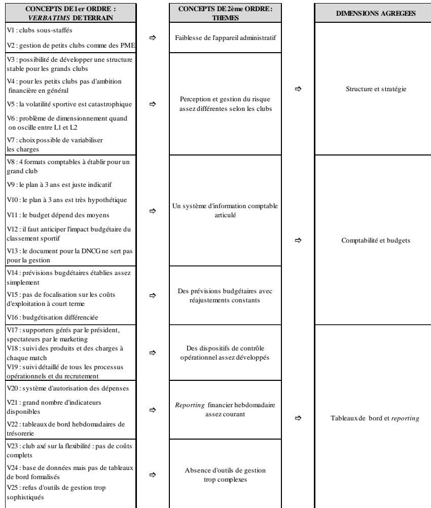
Schéma 2 : Structuration des verbatim recueillis