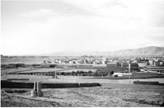
Figure 3 : Fermes avec puits individuel strictement délimitées par des murs, fonctionnelles au second plan et en cours d'aménagement au premier plan

pendant la sécheresse (1987) et après la sécheresse (1999) (Taïbi & El Hannani, 2004).