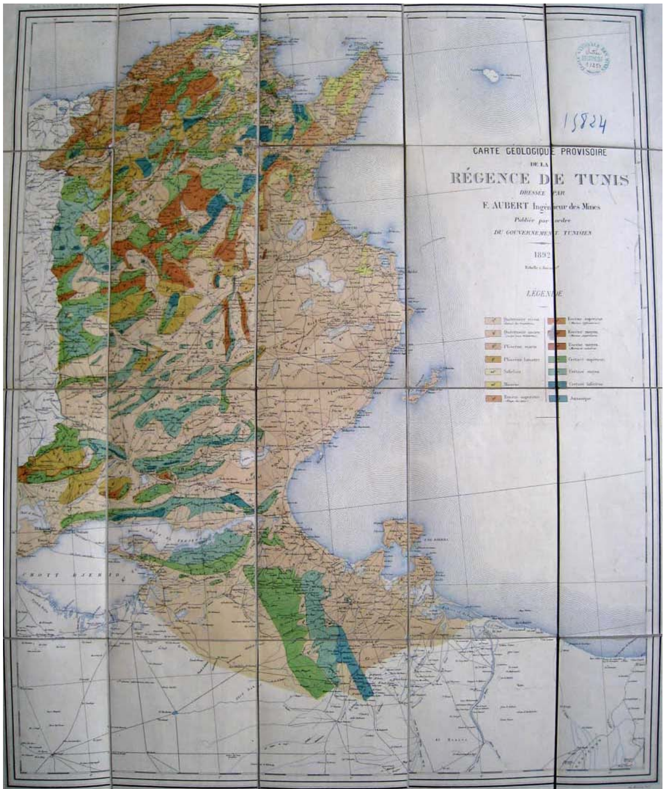
La carte d' Aubert , qui fut la 1ère carte géologique de la Tunisie (1892)