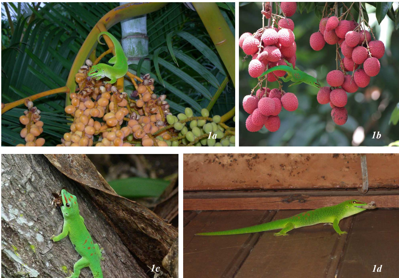
Figure 1. – Phelsuma grandis Gray, 1870 s'alimentant 1a) sur les fruits d'un palmier multipliant ( Dypsis lutescens ) ; 1b) sur les fruits de litchi ( Litchi sinensis ) ; 1c) d'un coléoptère ; et 1d) d'un gecko nocturne ( Gehyra mutilata ).

Le régime alimentaire de P. grandis est encore mal connu. En milieu naturel, la littérature signale la consommation de nectar de fleurs, de pulpe de fruits, de bourgeons floraux (PROBST, 1999 ; KRYSKO & HOOPER, 2006, 2007 ; COLE, 2009 ; SANCHEZ non publié), d'Arthropodes (PROBST, 1999 ; COLE, 2009) et de petits vertébrés, dont des juvéniles conspécifiques (BUCKLAND, 2009 ; COLE, 2009). En captivité, l'espèce consomme également du nectar de fleurs et de la pulpe de fruits (SWITAK, 1966 ; TYTLE, 1992 ; HENKEL & SCHMIDT, 1995 ; FURRER et al. , 2006 ; KOBER, 2008), des Arthropodes : Blattidae, Acrididae et Tenebrionidae (SWITAK, 1966 ; DEMETER, 1976 ; TYTLE, 1992 ; HENKEL & SCHMIDT, 1995 ; FURRER et al. , 2006 ; KOBER, 2008 ; KLARSFELD, 2010) et de petits vertébrés : geckos, anoles et jeunes souris (KLARSFELD, 2010 ; SANCHEZ non publié) (Fig. 1).