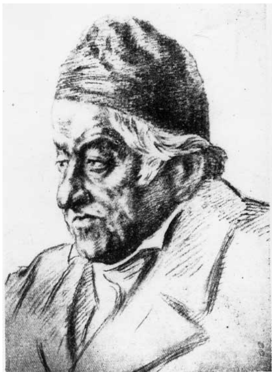
Ami Boué (1794-1881)

L'occasion de présenter ce texte est fournie par le 160ème anniversaire de la première mission d'Ami Boué dans la péninsule Balkanique, réalisée en 1836, et qui marque le début de la géologie bulgare et en général de la Balkanologie.