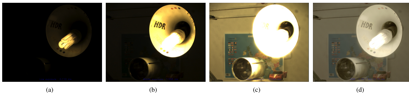
FIGURE 3 – Résultat du système complet. Notre contrôle d'exposition multiple peut choisir les trois temps d'exposition adéquate, et le MMU nous permet de diffuser en parallèle les trois flux vidéos au sein du FPGA. La frame HDR correspondante à la reconstruction des trois frames courante (a), (b) et (c) est directement visible en sortie de notre caméra après une latence de traitement de 1, 2 \mu s.