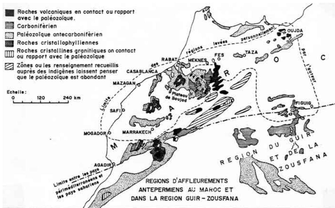
Fig. 4 - Affleurements de Paléozoïque figurés par Ph. Russo in Etat actuel des connaissances sur les terrains paléozoïques du Maroc (13e Congrès international de Bruxelles, 1922, publications en 1925). Les grandes régions paléozoïques du Maroc de l'Ouest commencent à être bien perçues en particulier pour le Maroc central, la Meseta côtière, les Rehamna, les Djebilet.

Le Congrès de Bruxelles (1922, publications en 1925) permet de présenter la jeune géologie marocaine devant un aréopage international. Russo se chargea de l'Etat actuel des connaissances sur les terrains paléozoïques du Maroc (Fig. 4). Il faut préciser que pour lui le Silurien englobait encore le Cambrien.