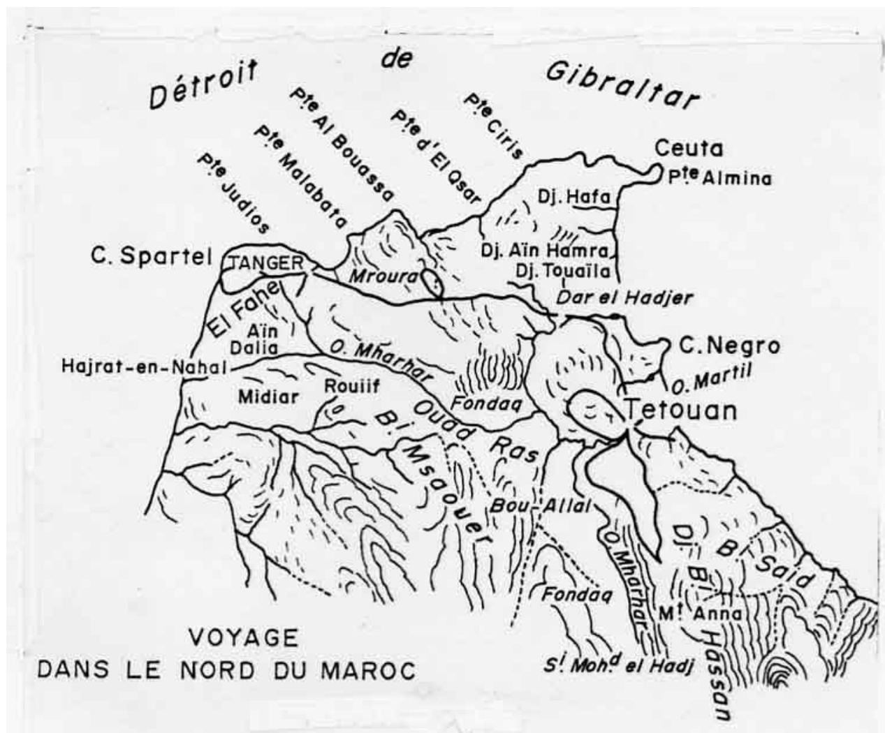
Fig. 2 - Connaissance topographique du Rif, extraite de Dans le bled es Siba . Explorations au Maroc. Ouvrage publié par L. Gentil (1906), sous le patronage du Comité du Maroc. Mission de Segonzac.