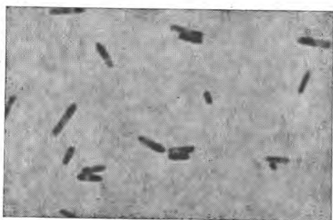
Figure 2. — Clostridium tyrobutyricum isolé du fromage Cashcaval de Dobroudja. On observe les spores. (Coloration des spores.)

On a préparé une émulsion de ce fromage, dans de l'eau physiologique. Cette émulsion a été chauffée à 85° C pendant 10 minutes. A l'examen microscopique, à côté des monocoques et des streptocoques, on a constaté des formes bacillaires, en petits bâtonnets, qui prennent la coloration de Gram. Ces bacilles rappellent le Clostridium Welchi .