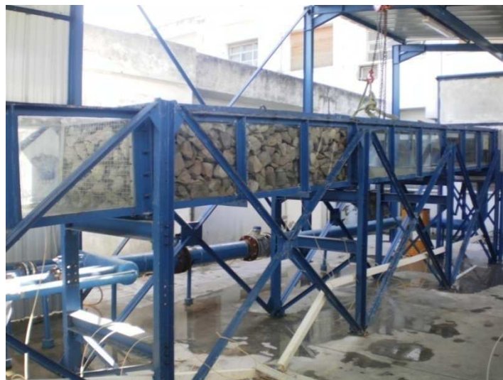
Figure1: Vue du canal construit au laboratoire de l'INAT [7]

l'écoulement. Le haut du canal est construit en tôle avec quelques fenêtres en verre, à travers lesquelles se font le remplissage et la vidange des enrochements. Le tout est en équilibre sur des supports en tôle. La pente du canal varie entre 0 et 15%, et le réglage de cette dernière se fait en variant la hauteur des supports. L'amont du canal est relié à un réservoir de capacité 3.6m^3 , par l'intermédiaire de caoutchouc flexible, ce qui permet d'atteindre de fortes pentes. À l'intérieur de ce réservoir une grille à nid d'abeille, assure la tranquillisation de l'écoulement. L'écoulement se déverse à l'aval du canal dans un bac d'une capacité de 9m^3 . Le niveau d'eau au droit du déversement est contrôlé par une vanne glissière. Trois pompes centrifuges, de 10l/s chacune, assurent la circulation de l'eau du réservoir aval vers le réservoir amont par une conduite unique. La conduite d'amenée est équipée d'un débitmètre électromagnétique permettant la mesure du débit. La mèche est réalisée par l'empilement, sur une longueur L_m , d'enrochements maintenus par deux grilles, à l'amont et à l'aval de la mèche.