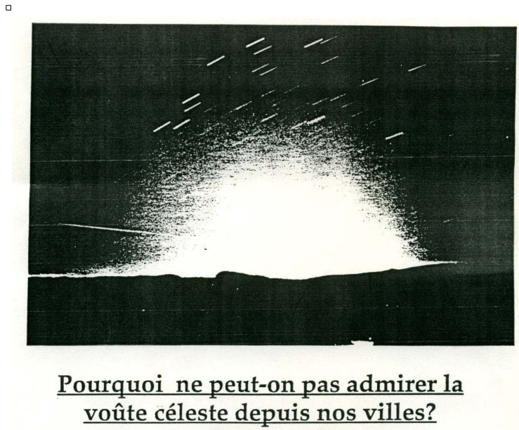
Image 5. Extrait d'un fascicule de sensibilisation à la problématique de la pollution lumineuse. Début des années 1990, Fédération d'Astronomie Populaire Amateur du Midi.

astronomes d'une part, et les acteurs institutionnels de l'éclairage d'autre part, au premier rang desquels se place l'Association Française d'Éclairage (AFE, 2006). Jusqu'à la fin des années 1990, leur argumentaire et leurs revendications trahissent avant tout la défense d'intérêts sectoriels : il s'agit ainsi de « Sauver notre ciel » bien plus que de « Sauver la nuit » dans son ensemble (image 5).