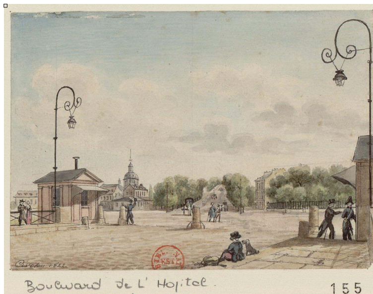
Image 1. Intégration des luminaires dans l’esthétique urbaine. Paris, Boulevard de l’Hôpital. Christophe Civeton, 1822.

sormais – outre d’assurer la sécurisation des lieux, des biens, des personnes et de leurs déplacements dans la ville –, de recomposer les espaces et de promouvoir, par le biais de la « mise en lumière », la ville et les valeurs urbaines dans leur ensemble [Deleuil et Toussaint, 2000 ; Mosser, 2003 ; Mallet, 2009].