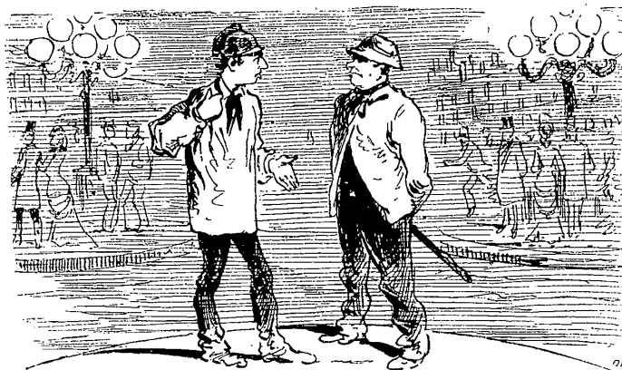
Fig. 34. — Sont-ils assez embêtants avec leur lumière électrique ? — Oui, maintenant on ne sait plus où aller travailler ! (Dessin de Draner, 1880 ; collection de l’auteur.)