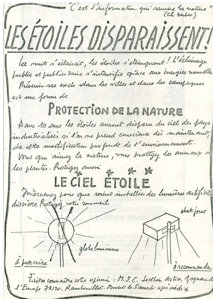
Image 3. L'aspect manuel des premiers supports de mobilisation, avant que celle-ci ne se structure et ne s'institutionnalise véritablement. Tracte de la « Section Astro » de la MJC de Rambouillet, fin des années 1980, archives personnelles de l'auteur.

De cet empirisme est né ce qui, plus tard, après persistance, est devenu le principal tort des cartographies générées par des équipes universitaires proches des astronomes : utiliser, pour quantifier la pollution lumineuse, des unités et échelles qui ne « parlent » qu'à eux-mêmes, comme la mesure de la brillance du ciel en magnitude par arcseconde carré, ou l'échelle de Bortle se référant à la visibilité plus ou moins bonne des étoiles pour quantifier la pollution lumineuse (Bortle, 2001). Il n'en reste pas moins que ces modèles montrent un polluant sortant largement des seules limites morphologiques de la ville, d'une part pour des raisons de conception des luminaires si l'on s'attache au flux directement émis dans l'hémisphère supérieur, et d'autre part à cause des mécanismes de diffusion à l'œuvre, notamment dans les