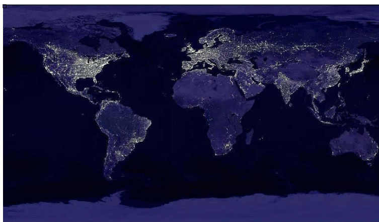
Image 4. La Terre vue de nuit. Image satellitale composite (Defense Meteorological Satellit Program).

Mais au-delà de leur intérêt scientifique, les cartographies de l'empreinte lumineuse ont, dès leur apparition, fortement contribué à la publicité des nuisances rencontrées par les astronomes. Toute l'iconographie désormais bien connue de « la Terre vue de nuit » a marqué les esprits dans un contexte de montée en puissance de la pensée environnementale : les images satellitales produites par le DMSP (image 4) montrent ainsi ce que les astronomes ont rapidement appelé une « pollution lumineuse » généralisée dans les pays industrialisés de l'hémisphère Nord (Cinzano et al. , 2001).