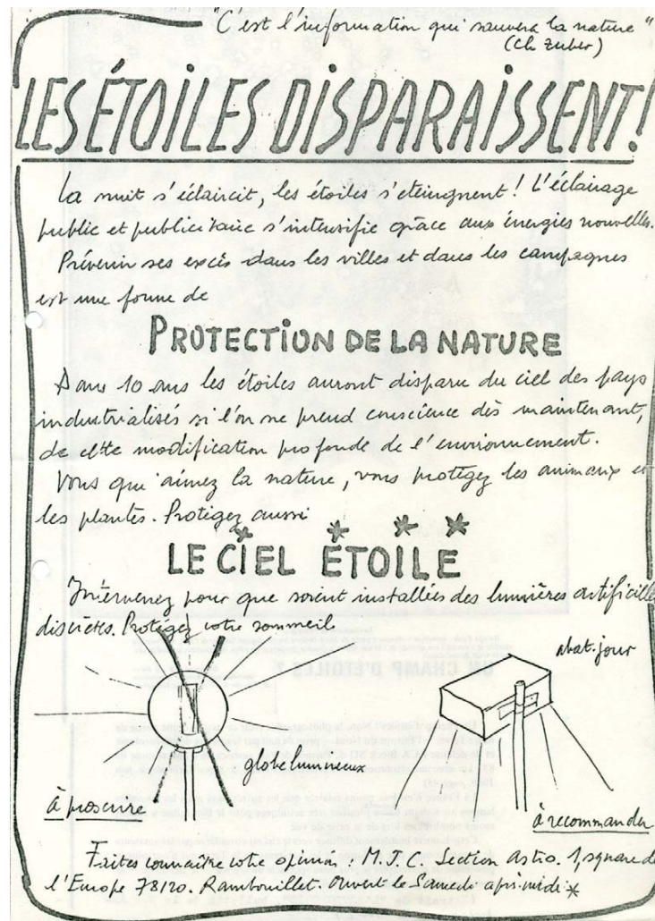
Image 3. L'aspect manuel des premiers supports de mobilisation, avant que celle-ci ne se structure et ne s'institutionnalise véritablement. Tracte de la « Section Astro » de la MJC de Rambouillet, fin des années 1980, archives personnelles de l'auteur.

De cet empirisme est né ce qui, plus tard, après persistance, est devenu le principal tort des cartographies générées par des équipes universitaires proches des astronomes : utiliser, pour quantifier la pollution lumineuse, des unités et échelles qui ne « parlent » qu'à eux-mêmes, comme la mesure de la brillance du ciel en magnitude par arcseconde carré, ou l'échelle de Bortle se référant à la visibilité plus ou moins bonne des étoiles pour quantifier la pollution lumineuse (Bortle, 2001). Il n'en reste pas moins que ces modèles montrent un polluant sortant largement des seules limites morphologiques de la ville, d'une part pour des raisons de conception des luminaires si l'on s'attache au flux directement émis dans l'hémisphère supérieur, et d'autre part à cause des mécanismes de diffusion à l'œuvre, notamment dans les