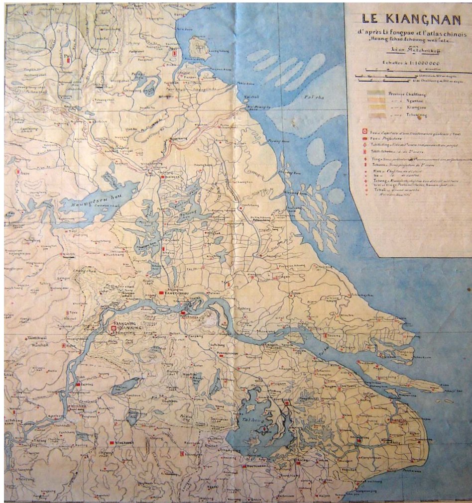
Fig. 1 : Carte manuscrite de Léon Metchnikoff, BGE, Département des Cartes et Plans, tiroir « Extrême Orient »