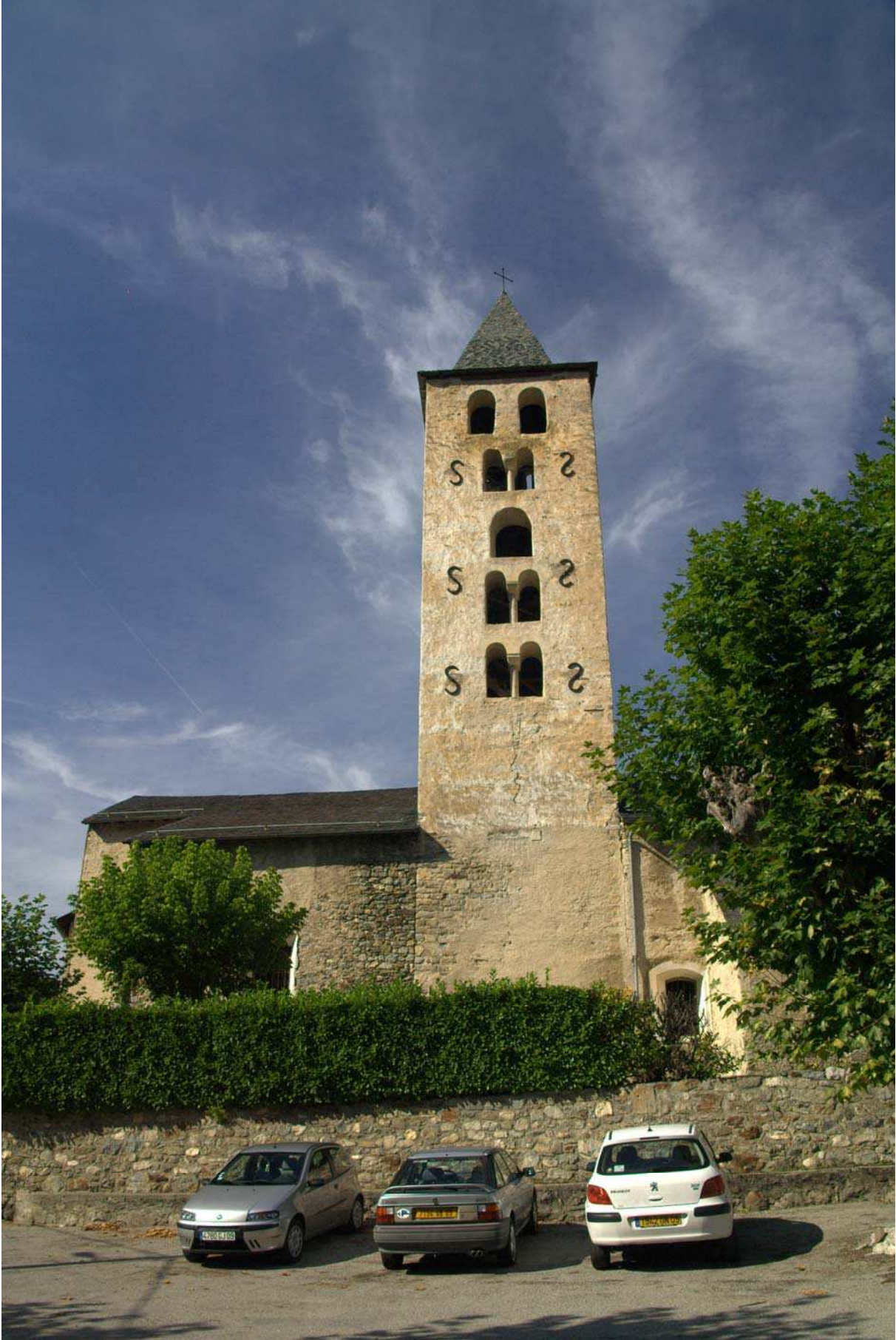
Fig 6 : fichier Arquizat église. Titre : L'église Saint-Hilaire d'Arquizat.