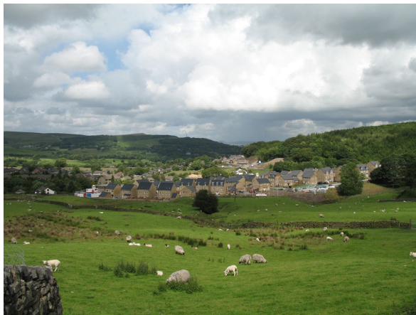
Planche photographique n° 1

sélectif. Concrètement, les campagnes et plus singulièrement encore le périurbain anglais sont dorénavant inaccessibles à une grande partie de la population et, inversement, n'attirent plus que les populations suffisamment aisées pour s'y implanter (T. Champion, 2001, 2006), pennines hebden bridge). A tel point que les géographes britanniques se sont réappropriés la notion à l'origine exclusivement urbaine 7 de gentrification pour décrire le processus de renouvellement des populations locales sous l'effet de l'implantation de nouveaux ménages appartenant aux catégories socio-économiques supérieures (J. Little, 1987 ; M. Phillips, 1993). Cette gentrification rurale se traduit alors par la transformation des sociétés et des paysages ruraux et périurbains desquels sont potentiellement expulsés les anciens résidents et plus généralement les ménages issus des catégories les plus modestes.