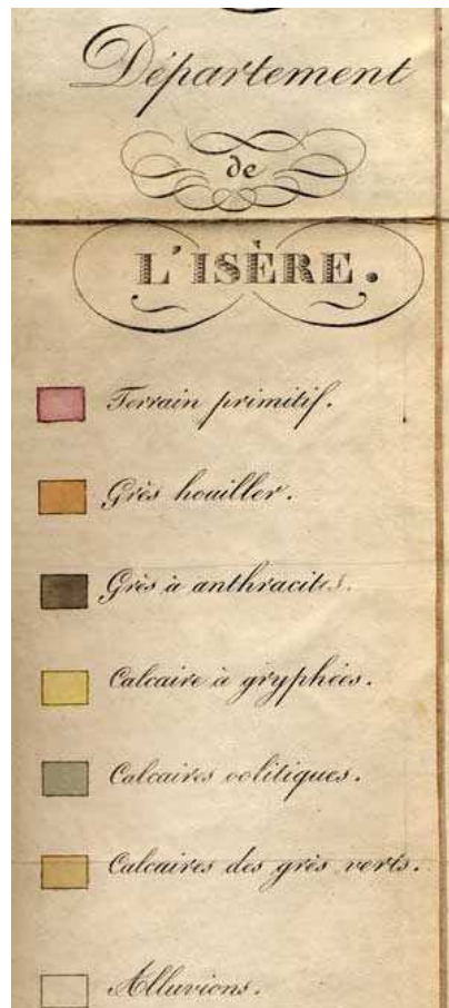
Légende de la carte géologique de Gueymard