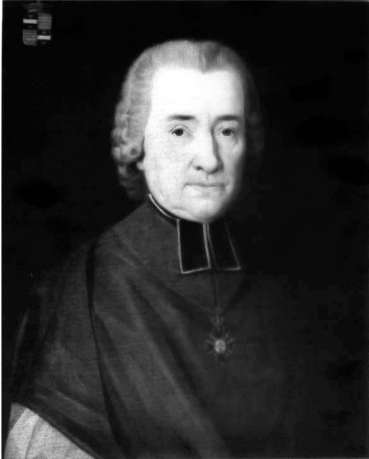
Fig. 1. L'abbé Louis-Hyacinthe d'Everlange de Witry, membre de l'Académie. Toile anonyme, Bruxelles, collection Jean Jadot.

L'abbé Louis-Hyacinthe d'Everlange-Witry (1719-1791), dont le goût très prononcé pour la physique et la minéralogie fut remarqué par le gouverneur général, fut nommé directeur de son cabinet de curiosités. À la mort de Charles de Lorraine, il fut chargé de dresser le catalogue de ses collections en vue de leur vente. Cet abbé, devenu chanoine de la cathédrale de Tournai, prolongea cette activité en collectionnant les fossiles de cette région. Il est entré dans l'histoire des sciences par sa présentation, en 1777, d'un mémoire à l'Académie Sur les fossiles du Tournaisis, et les pétrifications en général, relativement à leur utilité pour la vie civile (Piot, 1878). Ce mémoire est assorti de belles gravures représentant quelques-unes des pétrifications les plus remarquables de sa collection. Mais l'énumération reste teintée d'anecdotes et de commentaires sur les péripéties de la découverte ou l'usage que l'on peut en faire (Van Tiggelen, 1998). Cet ouvrage est le premier travail, au niveau mondial, consacré au calcaire carbonifère. La qualité de ses figurations paléontologiques a permis à G. Hahn, R. Hahn et C. Brauckmann (1986) de déterminer un des trilobites figurés et de rendre hommage à de Witry en lui dédiant le nouveau genre « Witryides ».