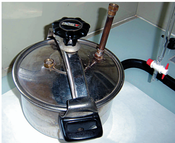
Figure 1 Exemple de récipient pouvant être utilisé