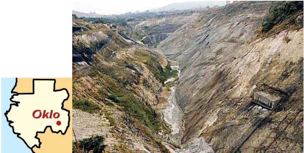
Site d'Oklo (Gabon)

L'abondante littérature sur le phénomène d'Oklo permet d'en approfondir la connaissance.