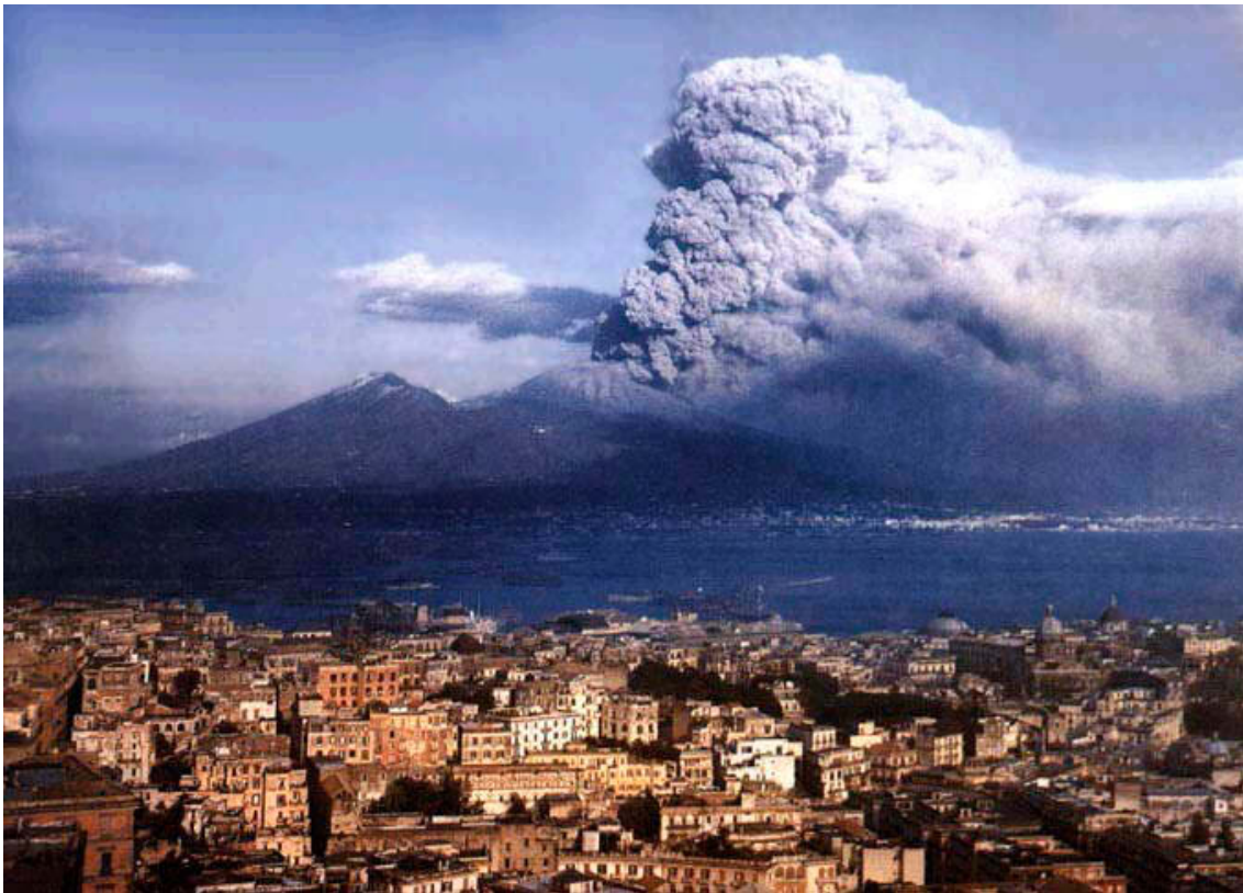
Deux images de l'éruption du Vésuve de 1944