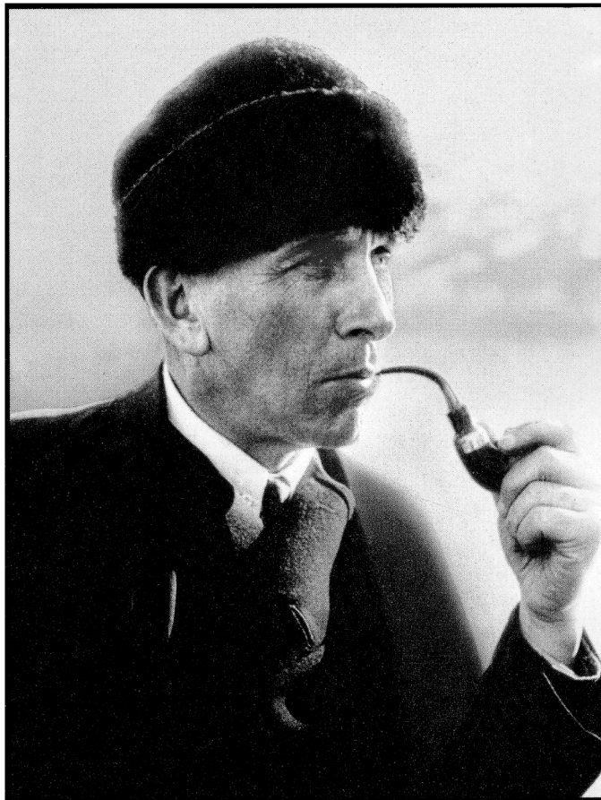
Figure 3. Alfred Wegener (1880-1930)