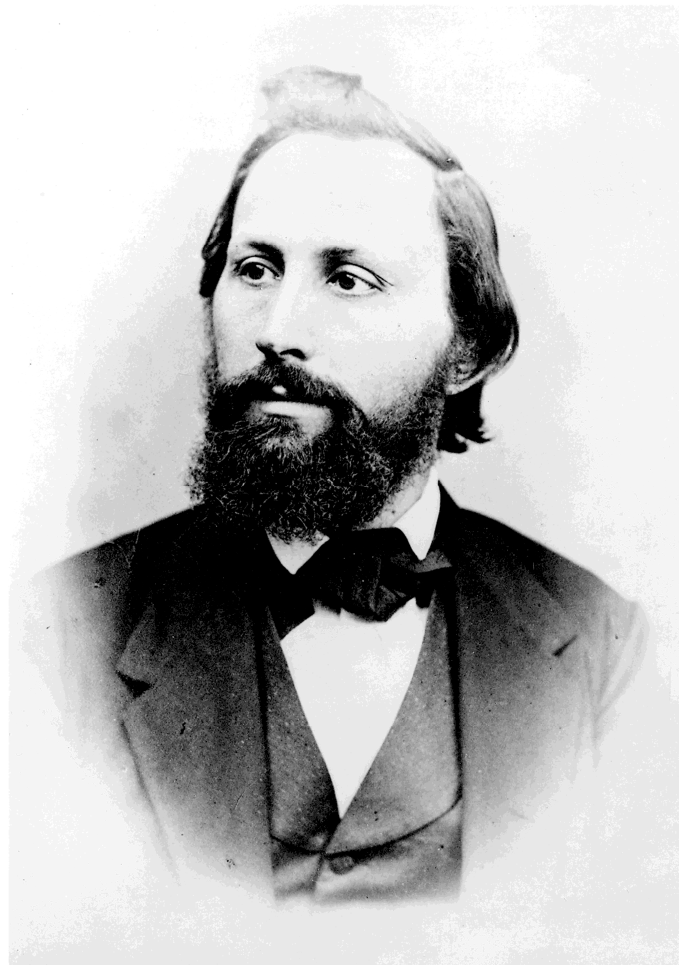
Figure 2. Eduard Suess (1831-1914)