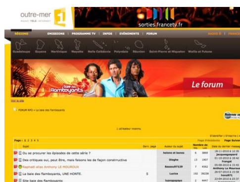
Fig. 9 : Le site de La Baie des Flamboyants

situations 32 ». Nous sommes donc allés chercher ce public non pas auprès de ceux qui regardent l'émission et constituent l'audience, mais auprès de ceux qui revendiquent leur position spectatorielle. C'est le troisième temps de la réception, celui de l'après-visionnage, qui a ainsi particulièrement retenu notre attention, temps durant lequel le public a fait entendre sa voix via le forum du site officiel 33 de la station 34 .