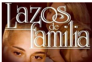
Fig. 2 : Laços de família (Brésil, Globo, 2000)