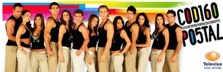
Fig. 7 : Código Postal (Televisa, 2006)

Tournée sous la direction de Gérard Espinasse 26 , la série domienne va proposer, en 100 épisodes de 26 minutes chacun, une nouvelle problématique, à savoir « le destin croisé de six familles et d'une jeunesse romantique née sous le soleil » ainsi que le résume la première ligne du synopsis. De nouveaux territoires sont donnés à voir, on quitte les plages mexicaines pour celles de la Guadeloupe, et de nouveaux comédiens sont engagés : ils sont originaires des DOM ou issus de la série adolescente Hélène et les garçons (TF1, 1992-94). L'objectif est de faciliter l'identification du public d'Outre-mer et de rajeunir ce dernier. Pour les promoteurs du projet, tous les ingrédients sont ainsi réunis pour que les audiences soient au rendez-vous.