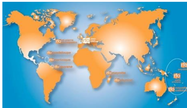
Fig. 4 : RFO et ses stations régionales

télévision de la diversité et de l’Outre-mer 5 , a fait de la diffusion des telenovelas une priorité, persuadé que ces séries sont « plus adaptées aux publics d’Outre-mer que les fictions françaises et européennes voire américaines 6 ». Pour répondre encore mieux aux attentes « supposées 7 » des publics de ses neuf stations régionales (voir figure 4), le réseau a fait une succession de paris afin de créoliser la telenovela : traduction et relocalisation de la production visent ainsi à lui donner une couleur plus domienne. Ce choix des diffuseurs désormais co-producteurs a pour objectif premier d’augmenter l’audience face à la concurrence des chaînes privées qui se disputent les faveurs des téléspectateurs à coup de programmations de telenovelas .