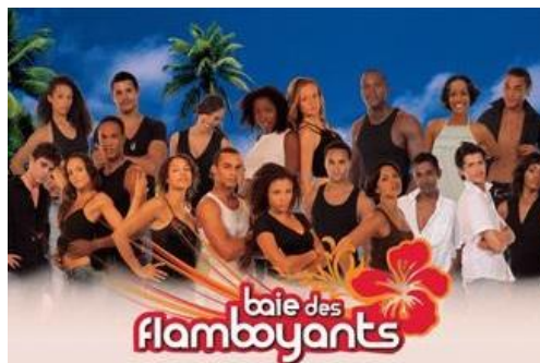
Fig. 8 : La Baie des Flamboyants (JLA-RFO, 2007)

L'étude de la réception de la première saison de La Baie des Flamboyants est envisagée ici en référence à un processus décliné en trois temps. Dans un premier temps, avant la rencontre avec le texte médiatique, on assiste à la mise en place du cadre de participation et d'interprétation 27 défini par la chaîne. La « promesse » que RFO fait à