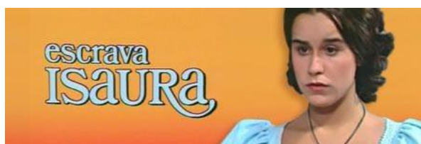
Fig. 1 : Escrava Isaura (Brésil, Globo, 1976)