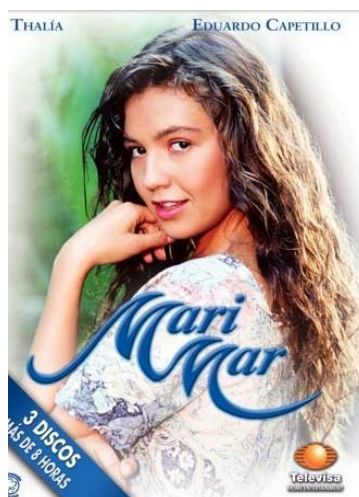
Fig. 5 : Marimar (Televisa, 1994)

La vie quotidienne réunionnaise a été scandée pendant l'année 2001 par la diffusion d'une telenovela mexicaine, Marimar 10 , et a vu la mobilisation sans précédent d'un public qui réclamait sa rediffusion à une heure de grande écoute. Parce que Thalia, l'actrice interprétant le personnage principal de Marimar (voir figure 5), avait suscité une très forte identification, il était courant d'entendre les téléspectateurs affirmer lors de nos enquêtes 11 et des micros-trottoirs effectués par la station régionale : « Marimar , c'est une créole, c'est notre histoire ». Nos premières recherches nous ont permis de mieux comprendre le formidable succès de cette telenovela à La Réunion, auprès de publics auxquels ce produit n'était pas destiné a priori 12 . Les raisons de cet engouement sont à chercher du côté de la proximité historique et socioculturelle entre l'île de La Réunion et les pays latino-américains, producteurs de ces séries.