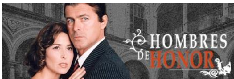
Fig. 3 : Hombres de Honor (Argentine, Canal 13, 2005)