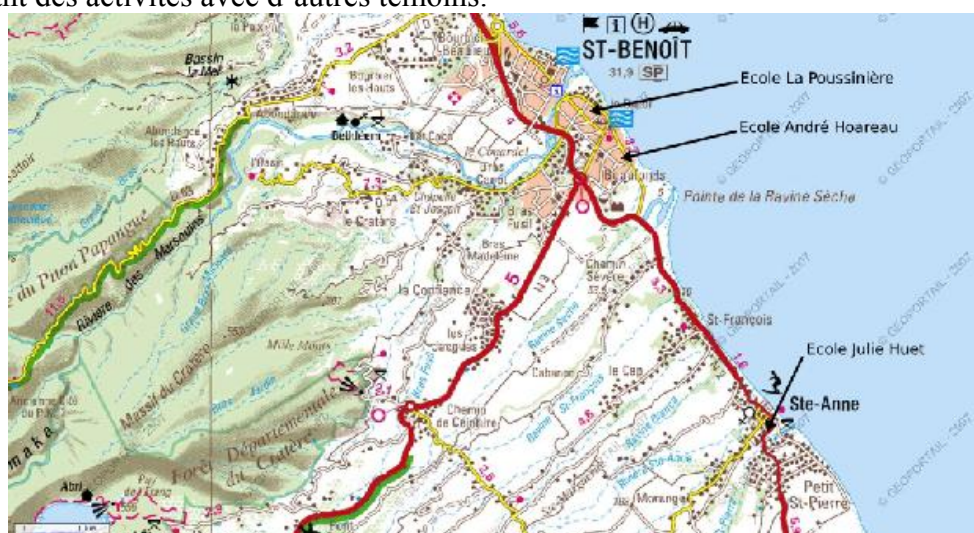
Fig 2. Les trois écoles bénédictines

À partir d'avril 2005, nos investigations ont concerné uniquement l'école La Poussinière, à Saint-Benoît, ville dont nous étions nous-même originaire. Comme dans toutes les écoles de notre échantillon, nous y gérons avec une grande liberté le temps que nous voulions consacrer à chaque enfant. Outre les bonnes relations que nous entretenions avec les enseignantes, dont la directrice et les Atsem, cette école présentait surtout de grands avantages pour nous au niveau « logistique ». Nous disposions en effet de deux salles à part, l'une, une ancienne salle de classe/loisirs inoccupée, où nous jouissions d'un espace pour recevoir les enfants au calme (ce qui n'était pas le cas partout), et l'autre, moins silencieuse certes (la BCD située à l'entrée de l'école), mais équipée d'un téléviseur et d'une pièce attenante d'où nous pouvions observer discrètement les interactions langagières des enfants laissés entre eux, tout en menant des activités avec d'autres témoins.