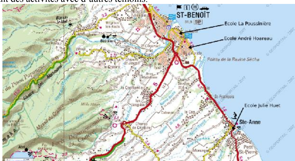
Fig 2. Les trois écoles bénédictines

À partir d'avril 2005, nos investigations ont concerné uniquement l'école La Poussinière, à Saint-Benoît, ville dont nous étions nous-même originaire. Comme dans toutes les écoles de notre échantillon, nous y gérons avec une grande liberté le temps que nous voulions consacrer à chaque enfant. Outre les bonnes relations que nous entretenions avec les enseignantes, dont la directrice et les Atsem, cette école présentait surtout de grands avantages pour nous au niveau « logistique ». Nous disposions en effet de deux salles à part, l'une, une ancienne salle de classe/loisirs inoccupée, où nous jouissions d'un espace pour recevoir les enfants au calme (ce qui n'était pas le cas partout), et l'autre, moins silencieuse certes (la BCD située à l'entrée de l'école), mais équipée d'un téléviseur et d'une pièce attenante d'où nous pouvions observer discrètement les interactions langagières des enfants laissés entre eux, tout en menant des activités avec d'autres témoins.