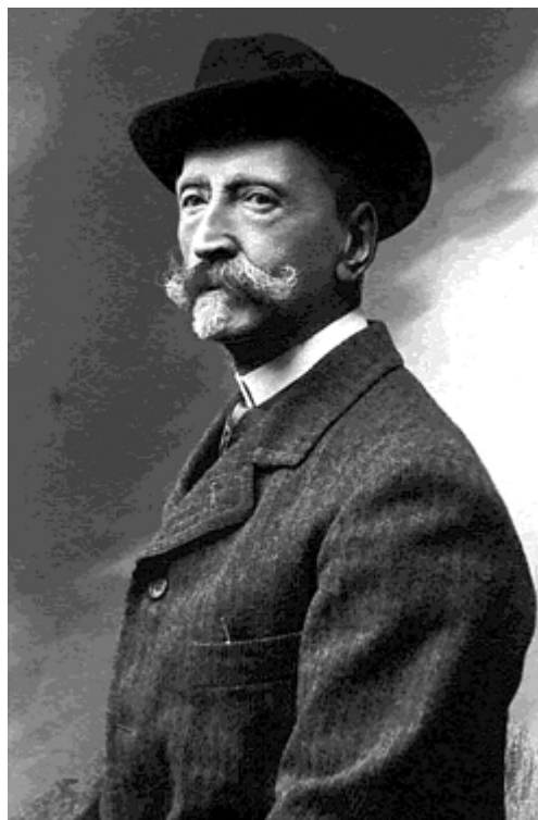
Figure 1. Portrait de Patrick William Stuart-Menteth.

Première polémique aussi, dès 1868, avec Félix Garrigou , l'un et l'autre se perdant dans l'identification, la nomenclature et la corrélation des poudingues (crétacés, éocènes, miocènes, pliocènes, glaciaires ou non) des Pyrénées, tous assimilés à l'emblématique poudingue de Palassou . Puis c'est le silence à peu près complet jusqu'en 1878. Il semble que, pendant cette période, il ait occupé un poste de géologue minier au Pays basque espagnol pour le compte de Rio Tinto (comme chef d'état-major des mines de Rio Tinto, dit-il lui-même dans une publication de 1910). Il proclame qu'il a également été correspondant de guerre pendant huit ans, lors de la seconde insurrection carliste. Mais celle-ci n'a duré que quatre ans (1872-1876) !