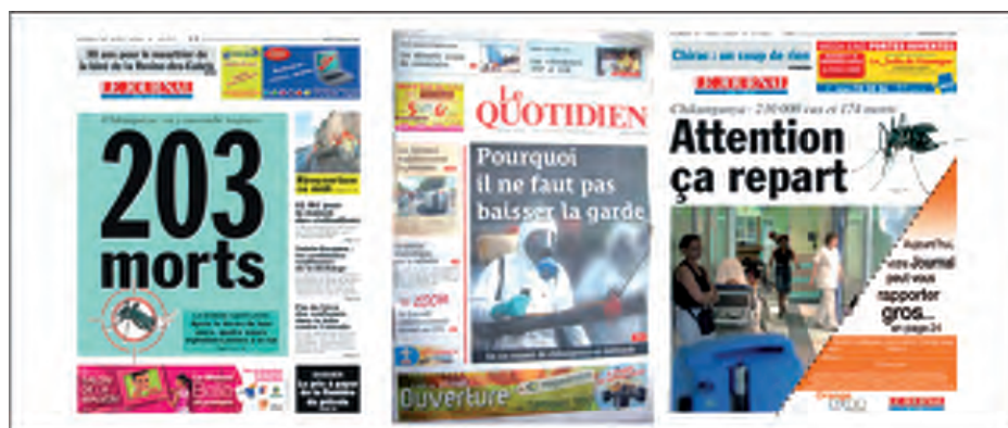
Figure 1 : Exemples de Unes de relance événementielle, parues après la fin du pic épidémiologique de mars 2006.

Dans les deux titres, les éditions sont accompagnées de « pages spéciales chikungunya » et d'éditoriaux d'autorité des rédacteurs en chef ou des journalistes spécialisés chargés de « couvrir » l'événement. Si janvier et février 2006 peuvent être qualifiés de paroxysmiques du traitement médiatique de la crise, la publication de « Unes » dramatisantes se poursuivent, quoique moins systématiquement, comme dans un élan cinétique, durant les mois de mars et avril 2006 (Pleines Unes, Jir – 1/04/06 : « Attention, ça repart » – 22/03/06 : « Chikungunya, on y succombe toujours, 203 morts, \frac{3}{4} Une Quot. , 17/03/06 : « Pourquoi il ne faut pas baisser la garde »).