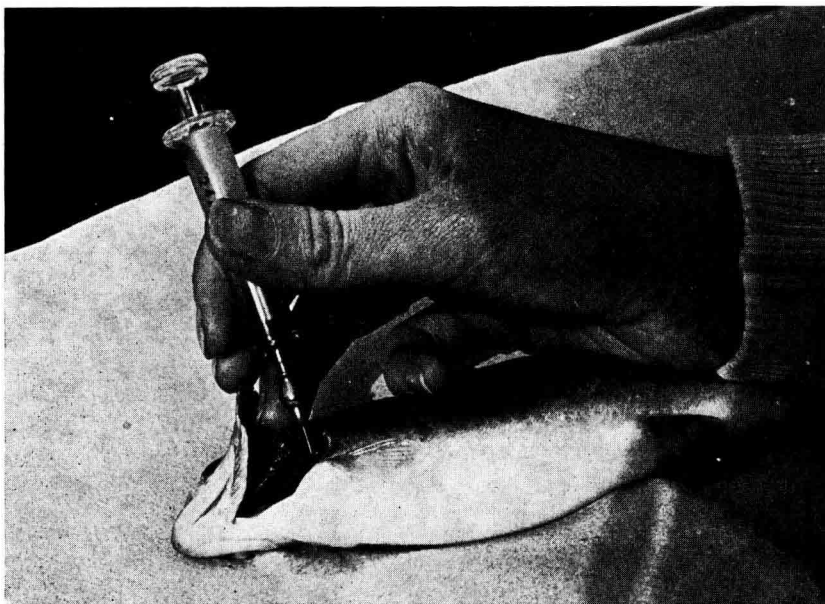
FIG. 2. — Photographie montrant la position de la seringue lors de la prise de sang

Les poissons (truites « portion » de 25 à 27 cm, 250 g environ) sont anesthésiés à la métacaine (M. S. 222 Sandoz) 100 p.p.m., et maintenus à plat, sur le flanc, à l'aide d'un linge. D'une main l'opérateur tient la tête de l'animal et soulève l'opercule à l'aide d'un doigt. De l'autre, il tient la seringue et enfonce verticalement l'aiguille héparinée (20/6 biseau + de 1 mm) à travers la paroi de la cavité branchiale, à l'intersection d'une ligne fictive joignant le sommet de l'orbite à la base de l'insertion de la nageoire pectorale et des feuillets branchiaux du 4 e arc. Il n'est pas nécessaire d'enfoncer l'aiguille profondément pour atteindre l'atrium : généralement 2 mm.