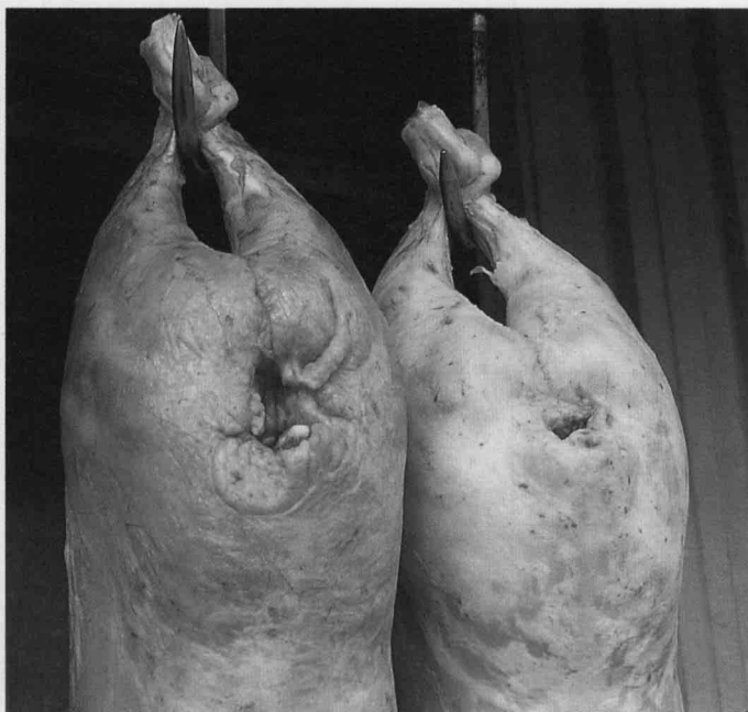
Défaut de fermeture du gras de couverture : le gras est huileux, même après ressuyage.