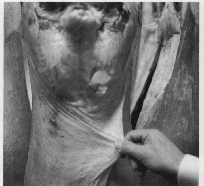
Gigots à gras de couverture brun-rouge (à gauche), et blanc (à droite).