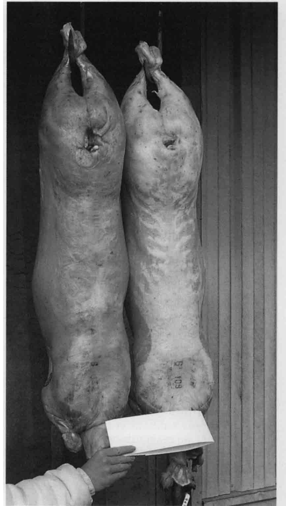
La carcasse de droite a une couleur correcte, celle de gauche présente un gras brun-rouge.