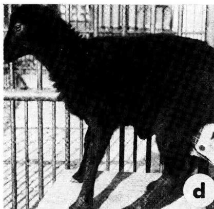
FIG. 1. — Les phénotypes pigmentaires rencontrés au cours des expériences de croisement. a) « sauvage », b) « noir et feu », c) rouge (pie), d) noir.

Pigmentary phenotypes in the crossing experiment.