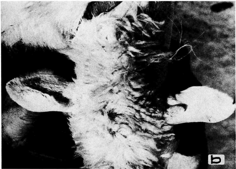
FIG. 2. — Types d'association des pendants chez le même animal