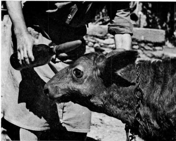
FIG. 3. — Un certain nombre de veaux à « tête de mouton » ont pu être élevés et commercialisés comme veaux de boucherie dans la zone du centre de Soual

Au centre de Soual en 1958 et 1959 Charmant a fourni 16 100 inséminations premières. Si l'on admet le pourcentage de réussite de 77,5 p. 100 du tableau 3 et la demi-pénétrance de 4,6 p. 100 \left(\frac{44}{973}\right) dans ce type de détection, le nombre des anormaux nés ou avortés de Charmant aura été de 564. Dans le même temps, les autres taureaux limousins réalisaient 86 239 I.A. premières. En admettant même qu'il ne naisse qu'un seul veau pour 2 inséminations premières (ce qui compense et au delà le fait que nous avons négligé les pertes embryonnaires précoces dont la portée financière est beaucoup moins grande que celle des avortés et des anormaux viables pour un temps) le pourcentage des veaux anormaux, avortés ou nés au centre de Soual aurait été de 1 p. 100 environ des veaux avortés ou nés de pères limousins au cours de ces deux années. Cela nous donne une estimation par excès des pertes puisque, malgré leur infirmité un certain nombre de veaux « tête de mouton » ont pu être élevés et commercialisés comme veaux de lait (fig. 3). Cette proportion n'excède toutefois pas 70 p. 100 et sans doute même pas 50 p. 100