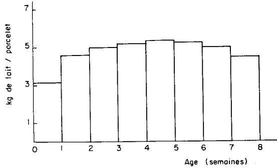
FIG. 1. — Quantité de lait de truie consommée par porcelet par semaine.