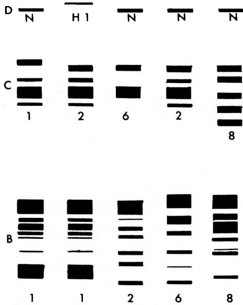
Fig 2. Représentation schématique des électrophorogrammes observés le plus fréquemment dans la collection d'orges étudiée.

la figure 1 sera notée : B8C8N. Nous avons gardé la numérotation de Montembault (1982) pour tous les types qu'il a déjà décrits.