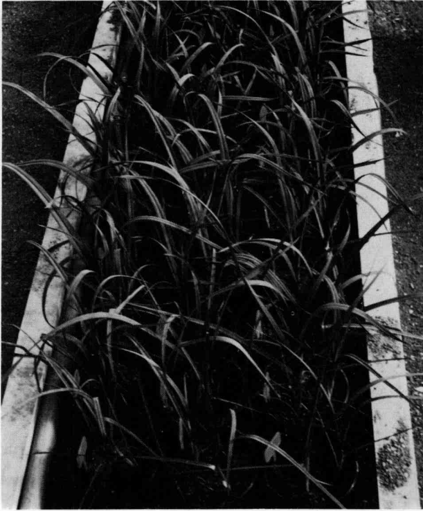
Figure 3 Un clone de poireau en serre, provenant de multiplication in vitro . A micropropagated clone of leek in the greenhouse.

nance apicale, si importante chez de nombreuses Monocotylédones, du méristème central (HUSSEY, 1976).