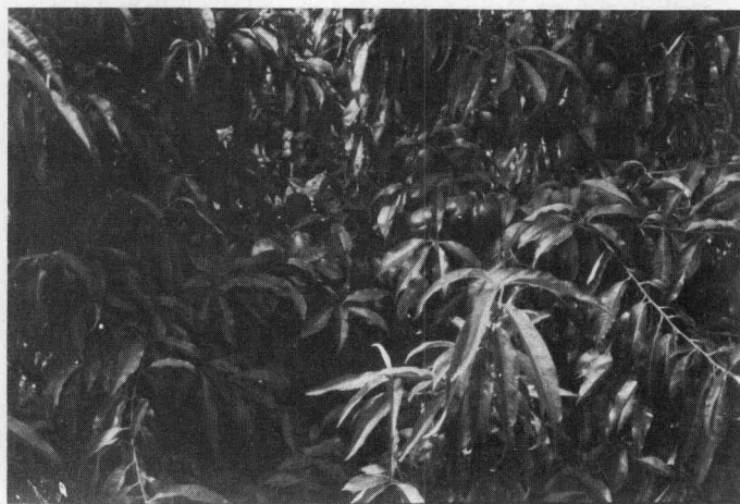
Figure 4 Fructification le 5.08.1982. Fructification on the 5.08.1982.