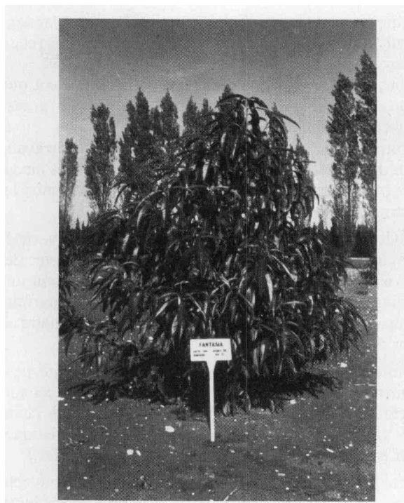
Figure 2 Un pêcher en verger, un an après la sortie de tube (9.10.1981). Hauteur de l'étiquette : 40 cm. A peach tree in orchard, one year after transplantation (9.10.1981).