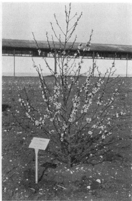
Figure 3 En fleurs le 15.04.1982. In flowers on the 15.04.1982.