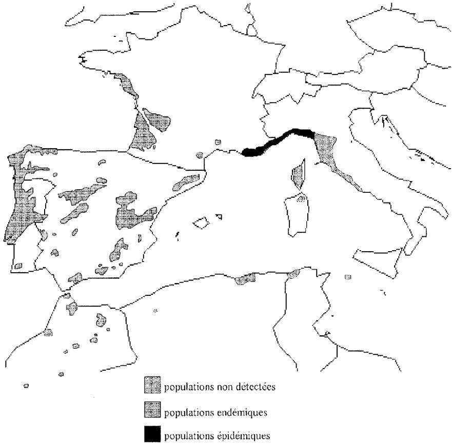
Fig 1. État des connaissances en 1988 sur la distribution géographique de Matsuococcus feytaudi Duc dans l'aire naturelle du pin maritime (d'après Destremau, 1974 ; Riom et Gerbinot 1977 et Baronio et Butturini, 1988).