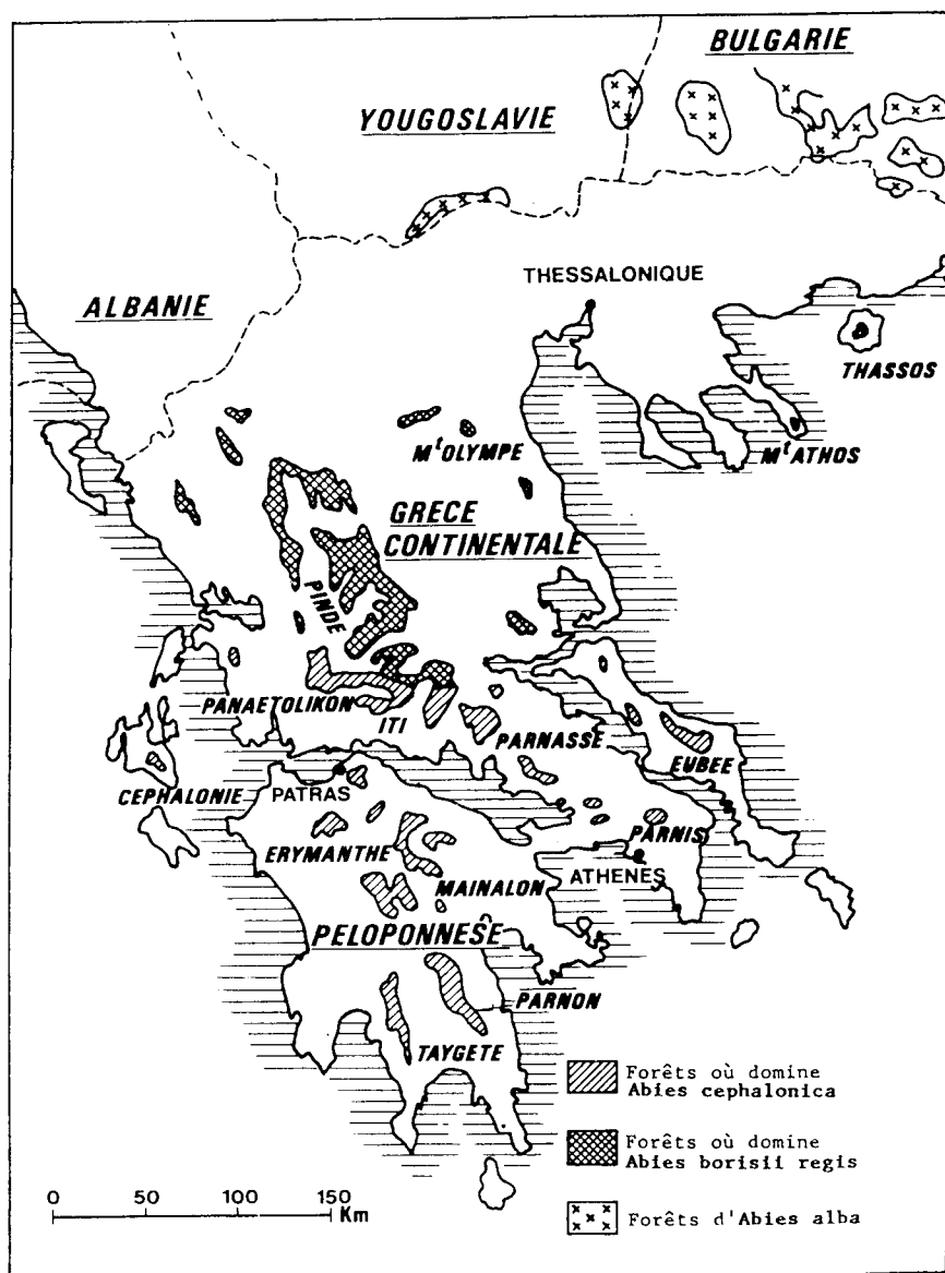
Fig 1. Aire de répartition des principales formations de sapins en Grèce.

1982 pour Pseudotsuga menziesii ; Cannell et Smith, 1983 pour Picea sitchensis ). En effet, il semble qu'un végétal ait surtout besoin, en liaison avec une variation de photopériode (Campbell et Sugano, 1975), d'une accumulation d'uni-