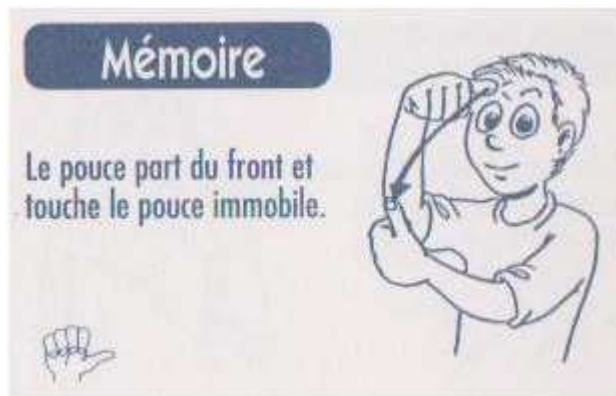
Figure 3 : MEMOIRE 'la mémoire', 'le mémoire' (Company, 1997 : 69)

L'exemple (10) illustre la façon dont une abréviation peut résulter de la perception visuelle de la langue environnante, via la lecture labiale. Ainsi les mots mon et mot ont la même image labiale. Ici nous avons proposé que l'abréviation de mon en mo