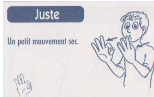
Figure 2 : JUSTE 'juste, précis, justement...' (Company, 1997 : 61)