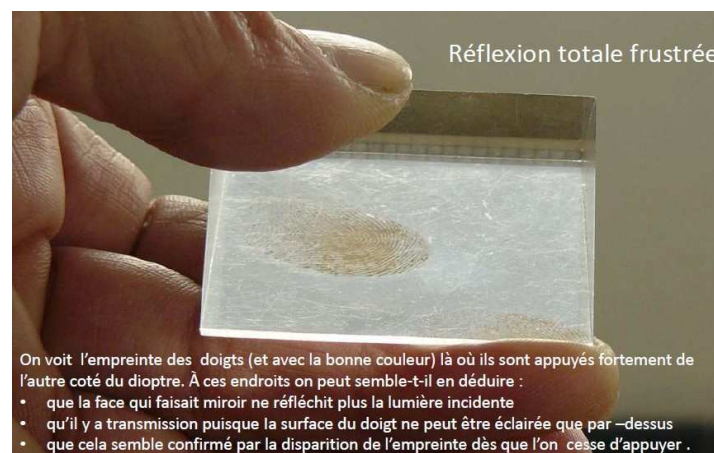
Figure 3 – Phénomène de réflexion totale frustrée avec un prisme (extrait du diaporama)

La suite de la présentation concerne la modélisation de ce phénomène de réflexion totale frustrée. Deux questions peuvent être discutées avec les élèves afin de les aider à clarifier le contenu de cette présentation. Premièrement : « Quel est le problème posé par l'expérience du doigt ? » La réponse pourrait être formulée ainsi : « Les lois disponibles en physique (lois de Snell-Descartes) ne permettent pas d'expliquer que l'on voit l'empreinte digitale (qui résulte d'un phénomène de réflexion totale frustrée) ». Deuxièmement : « Comment surmonter le problème ? ». La réponse à laquelle la discussion est supposée aboutir peut s'exprimer ainsi : « En modélisant la lumière à l'aide des nombres complexes. Il est possible ainsi de trouver des solutions pour les angles d'incidence au-delà de l'angle limite ("limite" dans le cadre d'une modélisation sans nombres complexes) ».