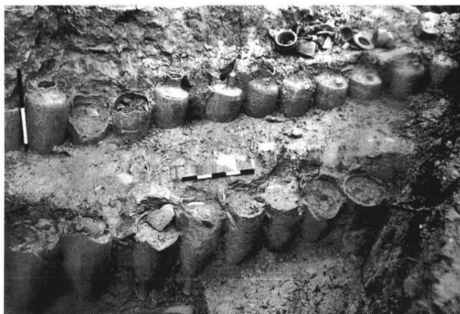
Fig. 46 – Arles, Trinquetaille, Île des Sables : alignements d'amphores servant d'armature à une digue de protection disposée en bordure du Rhône, vers 40-30 avant J.-C..

quence persistante de fortes fluctuations dans le débit du fleuve, au moins jusqu'au début du I er s. de notre ère.