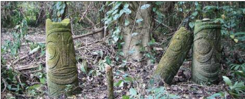
Stèles des esprits dule dans la forêt (Toga, Torres)

Les ancêtres et les morts vivent autour de nous, et nous guident dans nos vies de simples mortels. Seuls les initiés ont accès à leur monde, à leurs secrets, à leur langage. Certains hommes aux pouvoirs surnaturels – guérisseurs, devins, chamanes – peuvent même les voir dans leur monde (le Panoï ) et interagir avec eux. Ces sorciers reviennent alors dans le monde des vivants (le Marama ) pour exhiber les mystérieuses beautés qu'ils auront découvertes.