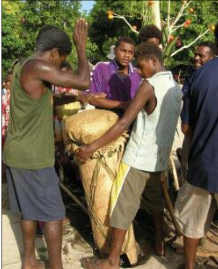
The single-headed drum during a nawha titi session (Toglag, Motalava)

In each titi piece, there is always a fleeting moment when the instruments suddenly stop ( yak in Mwothlap), before starting up again with even more fervour: this is heard at 0’56”, 1’39” and 2’35” in the song of the Rain [⊙25], at 1’26” and 2’26” in Liana flower [⊙27], at 1’04” and 2’46” in Volcano [⊙29]. This technique emphasises the group’s cohesion and strength.