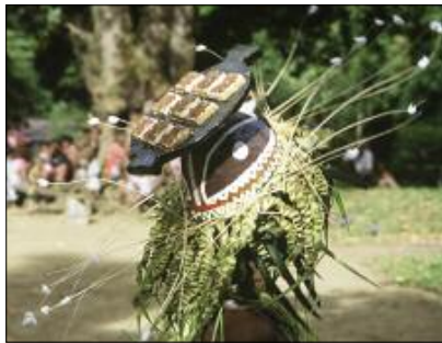
Coiffe de la danse mag , en forme de plat cuisiné (Jöla, Gaua)

Musicalement, le qat tout comme le mag ne mettent en jeu que deux instruments : le petit tambour à fente – joué par un musicien debout au centre de la place – et les sonnailles aux chevilles des danseurs.