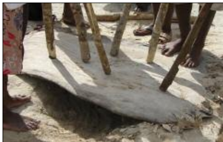
Planche à percussion tiyit rërë (Hiw, Torres)

Un idiophone assez répandu au Vanuatu, notamment dans les îles du nord, est la planche à percussion. Après avoir creusé dans la terre une petite fosse d’environ 50 cm de diamètre et 20 cm de profondeur – elle servira de résonateur – on pose dessus un morceau de bois assez massif, plus ou moins plat. Traditionnellement, cette planche est issue d’une racine-contrefort, plate et large, de certains arbres ; de nos jours, on peut y substituer n’importe quelle planche de bois. Trois à douze musiciens se tiennent debout autour de cette planche. Chacun est muni d’un ou deux bâtons plutôt légers, longs de 0,90 à 1,80 m, soit en bambou soit en bois