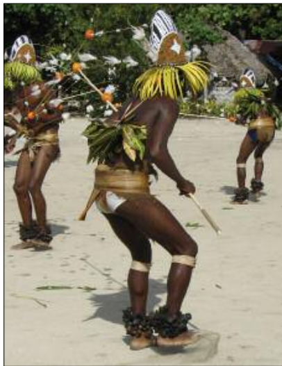
Ankle rattles for neqet dance (Lahlap, Motalava)

They are widely used in the Banks islands, especially in masked dancing performed by young initiates – whether the young men's dance called utmag in Merelava [☉36] or the spectacular neqet dance [photo] in Motalava [☉37]. In all these dances, the concussion of the dried nuts together accompanies the sharp striking of the small slit drums and the voices of the soloist singers, in a very characteristic musical soundscape.