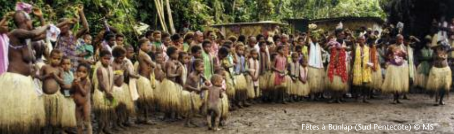
Fêtes à Bunlap (Sud Pentecôte)

Ce contraste entre musiques “locales” et musiques ressenties comme exogènes peut surprendre, lorsque l’on connaît la circulation constante des formes musicales entre communautés, qui souvent voyagent d’une île à l’autre de l’archipel. En d’autres termes, les musiques “d’ici”, que l’on assigne à la “coutume”, sont souvent déjà des musiques d’ailleurs, arrivées un jour par la mer. Malgré cela, un contraste subsiste dans les perceptions, entre une musique de la “coutume” et des formes qui n’y appartiendront jamais vraiment ( string band , chants d’église). Il est possible qu’un élément clef puisse expliquer cette dichotomie entre ces deux catégories de musique : la capacité des insulaires à en maîtriser toute la chaîne de production.