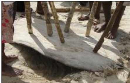
The percussion board tiyt rēre (Hiw, Torres)