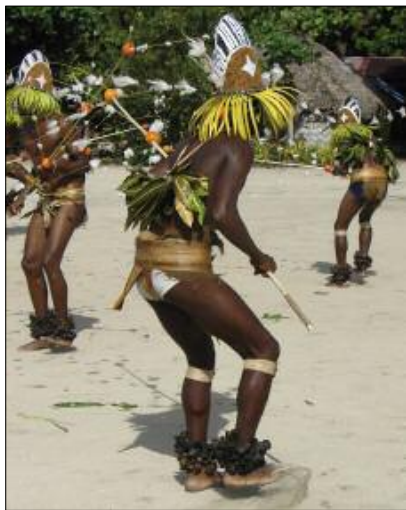
Sonnailles de chevilles dans la danse neget (Lahlal, Motalava)

Connues dans tout l'archipel du Vanuatu et au-delà, les sonnailles sont fabriquées à partir des fruits d'un végétal, Pangium edule , sorte de noix dont les coques sont vidées puis séchées au soleil, avant d'être tressées en grappes. La particularité de cet instrument est d'être normalement joué non par les musiciens, mais par les danseurs : les sonnailles sont attachées à leurs chevilles, et s'entrecho-