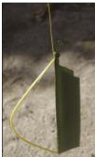
Bullroarer made out of a coconut leaf

The double rotation of the instrument – simultaneously above one’s head and on its own axis – results in a loud, deep humming sound. This recording features not just one, but three bullroarers – which together produce a truly powerful effect.