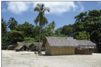
Un village côtier (Yugemène, Hiw, Torres)

Ce livret propose d'accompagner le lecteur dans ce voyage musical. Après avoir évoqué la place de la musique dans les sociétés du Vanuatu, nous présenterons leurs instruments de musique et décrypterons l'art de la poésie chantée. Enfin, l'auditeur pourra suivre le déroulé de l'album et le détail des 41 pièces à la découverte de l'univers musical de l'archipel.