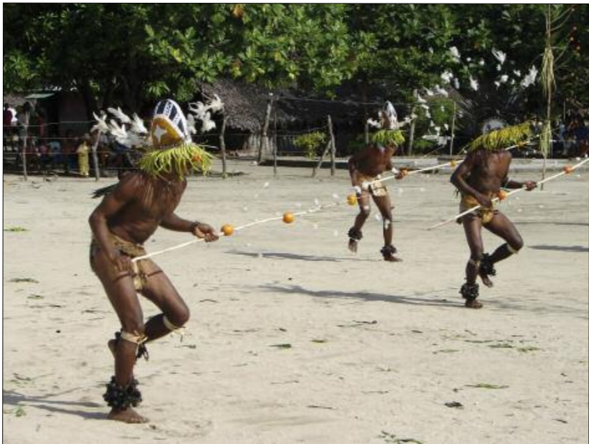
Dance of the spirits, the neqet (Lahlap, Motalava)

only be sung silently by the dancers, in their heart of hearts. The only sounds heard are not articulated words, but some form of shouts – either signals thrown by the key drummer (“ Hiy sito! ”), or the growling of the ancestors themselves.