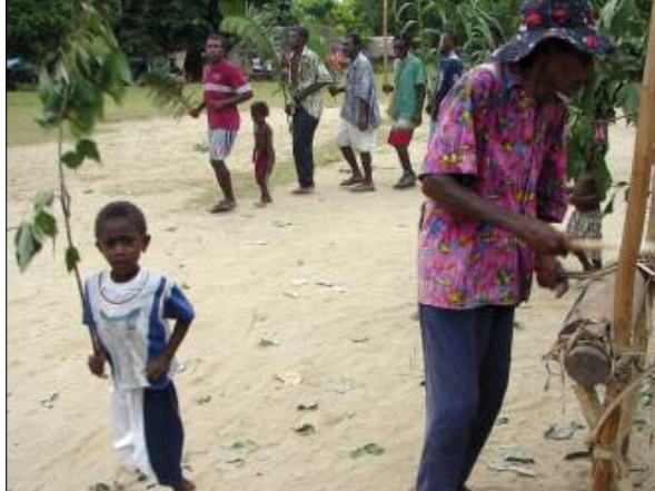
Danse noyongyep pour un mariage

La danse ka est en quelque sorte l'équivalent masculin de la danse sowahavin [⊙4, 12]. De forme responsoriale entre un soliste et un chœur, elle comporte une chorégraphie de groupe dont les déplacements sont travaillés collectivement. Le chanteur soliste frappe un grand tambour à fente en bambou appuyé contre la terre verticalement ; les danseurs portent tous des sonnailles de cheville. Parfois, les danses sont entrecoupées par des représentations de petites scènes humoristiques.