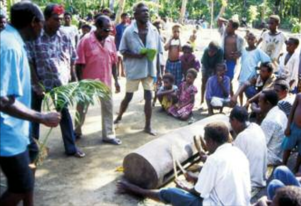
Chanteurs et musiciens autour du grand tambour à fente nokoy (Avay, Motalava)

lignes vocales et instrumentales superposées: le chant principal (“E ale...”) ; les cris de joie des danseurs ; un rythme continu au tempo rapide (dit beleg en mwotlap) que jouent, à l’aide de fins bâtons de bois, les deux percussionnistes assis aux deux bouts du tambour ; enfin, un autre rythme, plus discontinu, et au son plus sourd ( bōl ) – celui du tambourinaire principal, assis au centre de l’instrument.