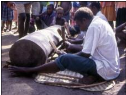
Slit gong nokoy (Motalava)

of Motalava, tēn in Lakon); the two drummers each side of him play with hard, lightweight sticks, producing a higher and more powerful sound ( beleg in Mwotlap, vuh in Lakon). The pattern is thus polyrhythmic, with each musician striking a different ostinato.