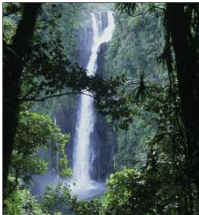
La grande cascade de Gaua

On peut lire ainsi les paroles des poèmes Pluie [©25], ou Volcan [©29]. Au passage, on notera la présence, dans plusieurs de ces poèmes, d’un même composé verbal sol duñ , littéralement “s’écouler retentir” dans la langue poétique. Sans équivalents dans la langue parlée, cette expression constitue un cliché poétique dans la langue des chants de Motalava : elle saisit le contraste entre la normalité d’un liquide qui coule ( sol “s’écouler”), et la surprise suscitée par un soudain bruit de choc ( duñ “retentir”). Dans le poème Le Fracas des Brisants cité plus haut, sol duñ traduit la force des vagues qui viennent se