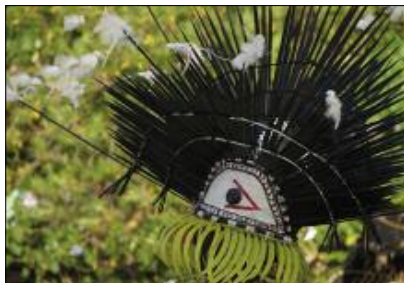
The spirit of the Urchin, neqet dance (Lahlap, Motalava)

One context in which music also formalises the bond between the living and the dead is that of secret societies (Vienne 1984, 1996). Boys of a same age group gather together, somewhere in the forest, under the aegis of a protective divinity, and learn from their elders a number of songs, dances and instruments reserved to the initiated. At the end of this period of reclusion, these