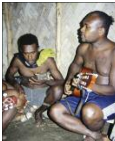
Soirée string band au village (Jôlap, Gaua)

propres aux musiques anciennes conservent leur identité propre y compris dans les compositions contemporaines : ainsi, lorsqu'un nouveau chant coutumier est créé – comme nous l'avons observé en 2005, à Motalava – il sera composé dans la langue des ancêtres.