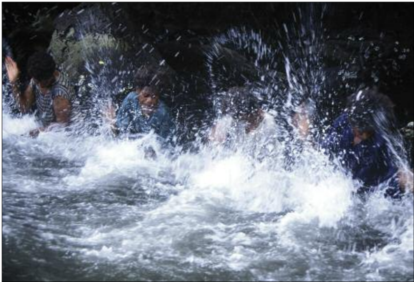
Jeux d'eau dans la rivière (Qtevut, Gaua)

main peut venir “caresser” ( hārāv ) la surface de l'eau, la “gifler” ( wes ), ou encore la “claque d'un coup sec” ( vuh tēqēl ). On peut produire un son léger en enfonçant dans l'eau juste deux doigts ( gisgis ), ou au contraire un son sourd en y plongeant soudain ses deux poings ( wej ). Le cri ( puow ) poussé par la meneuse donne le signal qu'on arrive à la fin