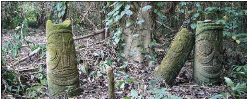
A spiritual stele dule in the forest (Toga, Torres)

The ghosts of our ancestors are never far away: they live on all around us, and guide the lives of mortals. Only the initiated have access to their universe, their secrets, their language. Some men endowed with supernatural power – shamanic healers, soothsayers, sorcerers – can even interact with