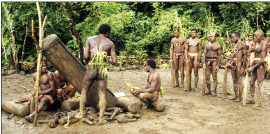
Grade-taking ceremony in Bunlap (South Pentecost)

In the islands of Pentecost, Ambae and Maewo the slit gong has preserved its original tie with graded societies, an institution still very much alive today. Among the attributes associated with certain grades are precisely certain drumming rhythms: these are always played on a group of several wooden drums of varying sizes [photo below]. In the