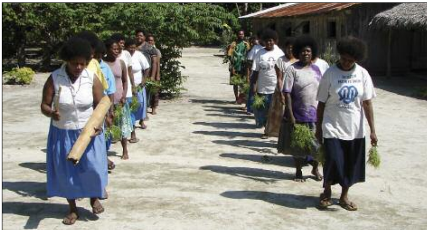
Danse des femmes rurumbë (Hiw, Torres)

Les deux premières pièces esquissent un paysage. On traverse la forêt au son d'une guimbarde solitaire, auquel répondent les lointains hullements d'un hibou [⊙1]. Une fois sur la côte, à l'embouchure de la rivière, les femmes de Jōlap claquent l'eau de leurs mains [⊙2].