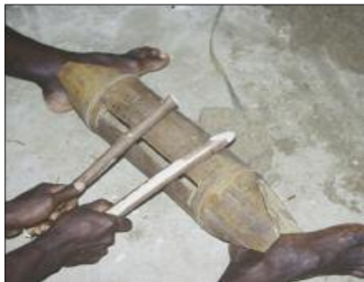
Bamboo slit drum (Motalava)

This little slit drum always has its own name in the languages of northern Vanuatu, to differentiate it from its big brother, the large wooden slit drum. For example, the Lakon language of west Gaua calls the large drum