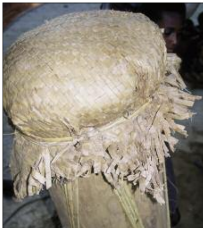
Tambour à membrane natmat-woh (Motalava)

D'une part, sur l'île de Maewo, un tambour à membrane existe encore, mais sa fabrication n'est connue que de quelques individus. Ce tambour se nomme tağura , c'est-à-dire "sagoutier", du nom du bois dans lequel il est fabriqué. Instrument tabou, il est utilisé lors d'une cérémonie exceptionnelle, Ġwatu ta Baruğū , à l'issue de laquelle il doit être détruit. Le nord des îles Banks possède également un tambour à membrane fabriqué dans un sagoutier. Après avoir évidé le tronc de sa pulpe, on obtient un fût d'environ 1,40 m de long et 40 cm de diamètre. On en recouvre