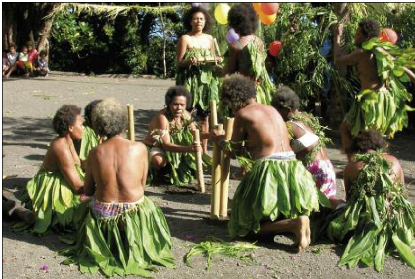
Bambous pilonnants dans la danse nombo (Merelava)