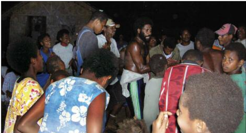
Soirée sawagoro au village (Umulongo, Maewo)

suisant. Quant au cercle extérieur, il est ouvert à tous – en particulier aux jeunes gens, garçons et filles, qui veulent se joindre à la danse. La foule des danseurs est parfois si dense qu'elle masque le petit groupe de chanteurs en son centre.