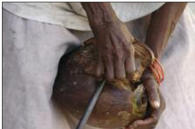
Coconut husking

The poem has two levels of reading. At first sight, this is an innocent physical competi-